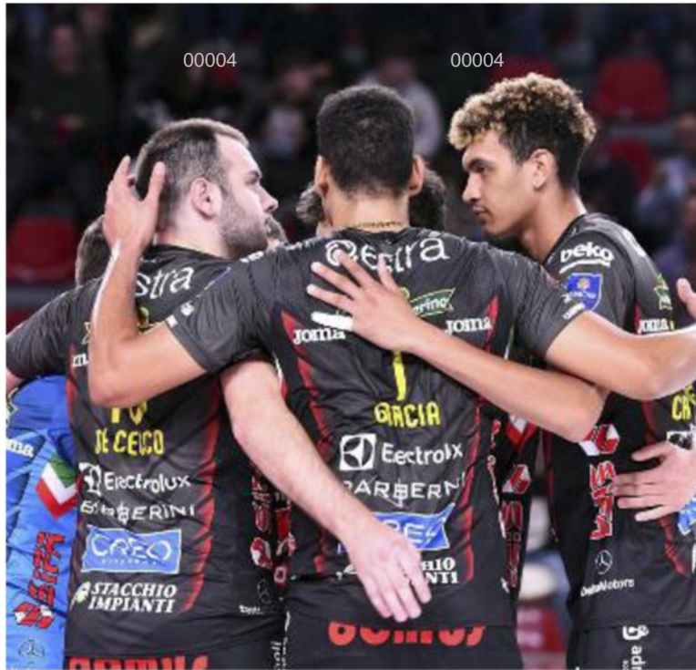
L'esultanza dei giocatori della Lube dopo un punto

ARTICOLO NON CEDIBILE AD ALTRI AD USO ESCLUSIVO DEL CLIENTE CHE LO RICEVE - 4