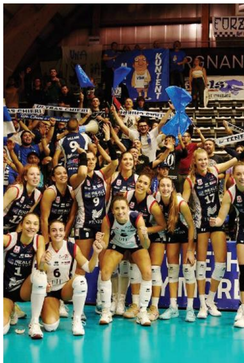
Chieri festeggia la vittoria (LUCA RAVERA)

Ieri, nell'anticipo dell'11ª giornata, la capitano Conegliano ha avuto la meglio di Firenze per 3-1 (25-18; 20-25; 25-18; 28-26). Le venete, sabato alle ore 20.30 (diretta Rai Sport) al Palazzo Wanny di Firenze contenderanno all'Igor Novara la Supercoppa Italiana. Confermata la partecipazione del Ministro per lo Sport e i Giovani Andrea Abodi , che premierà la vincitrice.