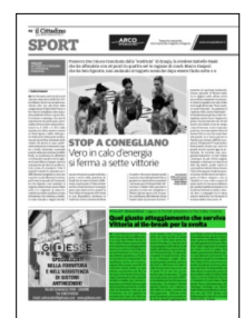
Superficie 15 %

ARTICOLO NON CEDIBILE AD ALTRI AD USO ESCLUSIVO DEL CLIENTE CHE LO RICEVE - 4