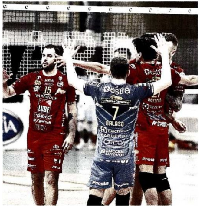
La Lube Civitanova punta a ritrovare a Piacenza la vittoria dopo lo stop imposto dal Covid domenica scorsa con il Siena