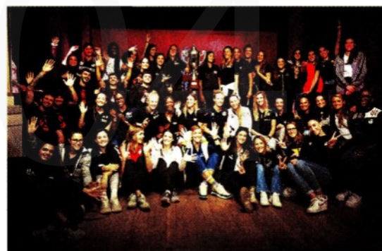
Teatro Gerolamo. La stagione 2022/23 è stata presentata lo scorso 19 ottobre

Prima della pandemia il torneo tricolore di pallavolo generava un giro d'affari di 40 milioni di euro