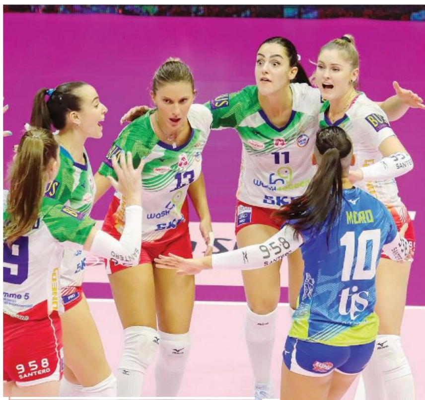
Per le ragazze della Wash4Green Pinerolo un buon debutto in serie A1 (DEL BO/VERO VOLLEY)

Ritaglio Stampa ad uso esclusivo del destinatario. Non riproducibile