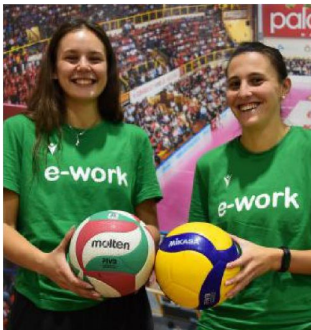
Dal Molten al Mikasa: l'A1 cambia il pallone