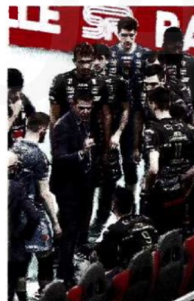
Timeout Lube a Trento