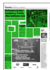
Superficie 46 %