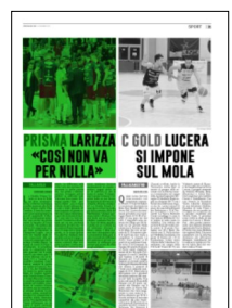
Superficie 43 %

match. La differenza sulla carta c'era: noi avevamo dimostrato in molte partite che, con grinta e determinazione, avremmo potuto mettere in difficoltà tutti. Volevamo fare questo. Purtroppo questa volta - prosegue l'atleta - non ci siamo riusciti o forse l'abbiamo fatto solo a tratti. Quando affronti squadre di questo calibro devi essere determinato per tutta la durata del match e non solo in certi momenti». Taranto ha retto soltanto per un set, perdendo malamente gli altri due: «Il secondo set è stato il parziale dove c'è stata vera e propria partita, ce la siamo giocata fino alla fine. Abbiamo fatto qualche errore di troppo, in tutti e tre i set. Non possiamo essere contenti dopo aver perso il primo e il terzo set a 17. Abbiamo commesso tanti errori, dobbiamo lavorare assolutamente su questo e metterci magari anche un po' di cattiveria in più in mezzo al campo. Il campionato è questo, nessuno ci regalerà nulla: se non facciamo qualcosa di diverso noi, il cammino diventa complicato». La Gioiella Prisma Taranto deve cercare la svolta, già dalla prossima sfida del PalaMazzola: «Adesso pensiamo subito a Modena. Non sarà facile, ma con il nostro pubblico possiamo fare bene. Sono un'ottima squadra, è partita un po' a rilento ma noi dobbiamo sfruttare il fattore campo. I tifosi possono darci una spinta in più. A prescindere dalla gara in casa o in trasferta, dobbiamo fare qualcosa in più noi. Lavoreremo in settimana per arrivare più pronti alla sfida con gli emiliani».