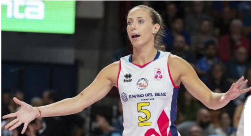
di Giampaolo Marchini

Ritaglio Stampa ad uso esclusivo del destinatario. Non riproducibile