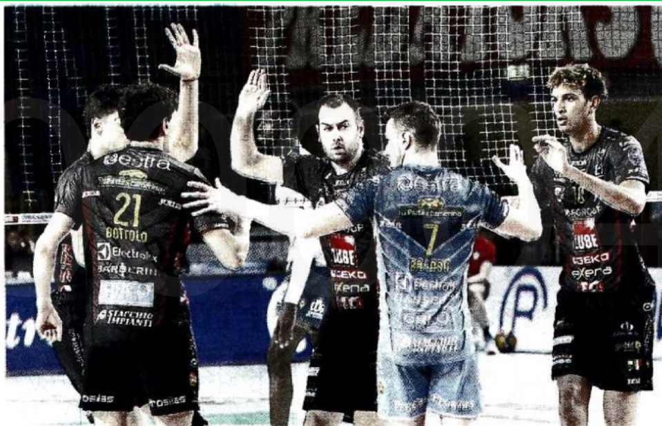
La Lube Civitanova questa sera è impegnata in Francia per il secondo match di Champions

ARTICOLO NON CEDIBILE AD ALTRI AD USO ESCLUSIVO DEL CLIENTE CHE LO RICEVE - 4