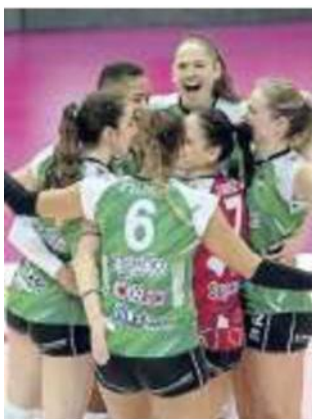
Le ragazze della Megabox dopo una vittoria