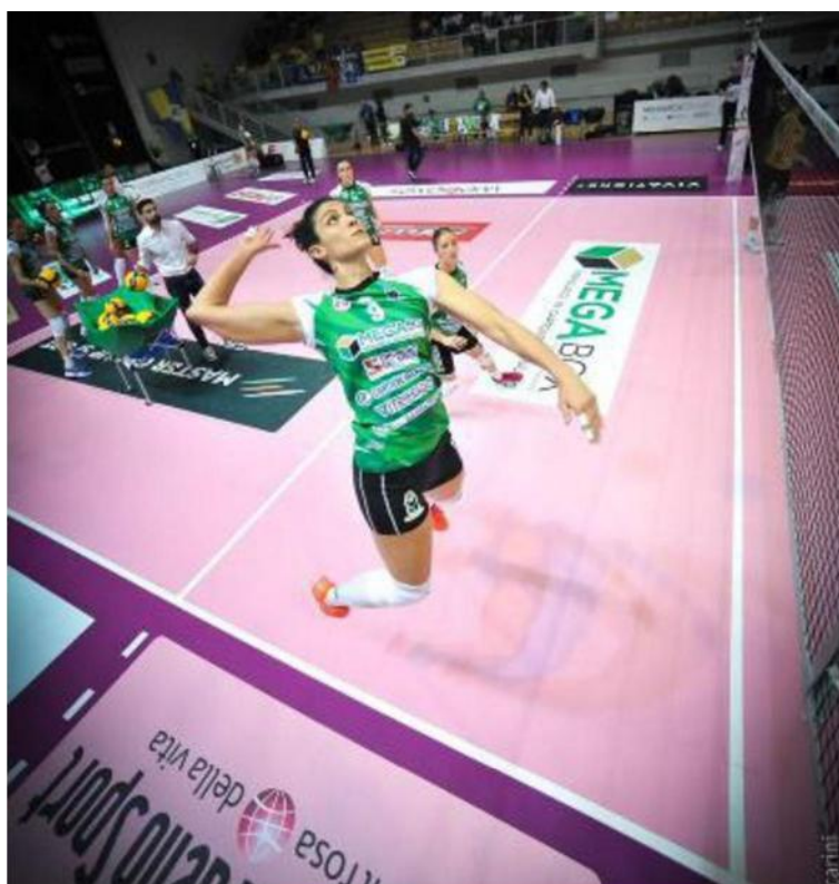
La flessione di Papa in schiacciata, alla Megabox servirà anche un grande collettivo

Ritaglio Stampa ad uso esclusivo del destinatario. Non riproducibile