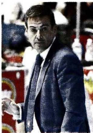
Il coach Blengini