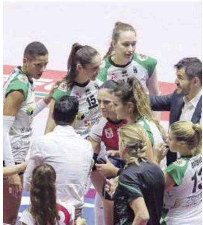
Un timeout della Megabox vallefoglia con il Vero Volley