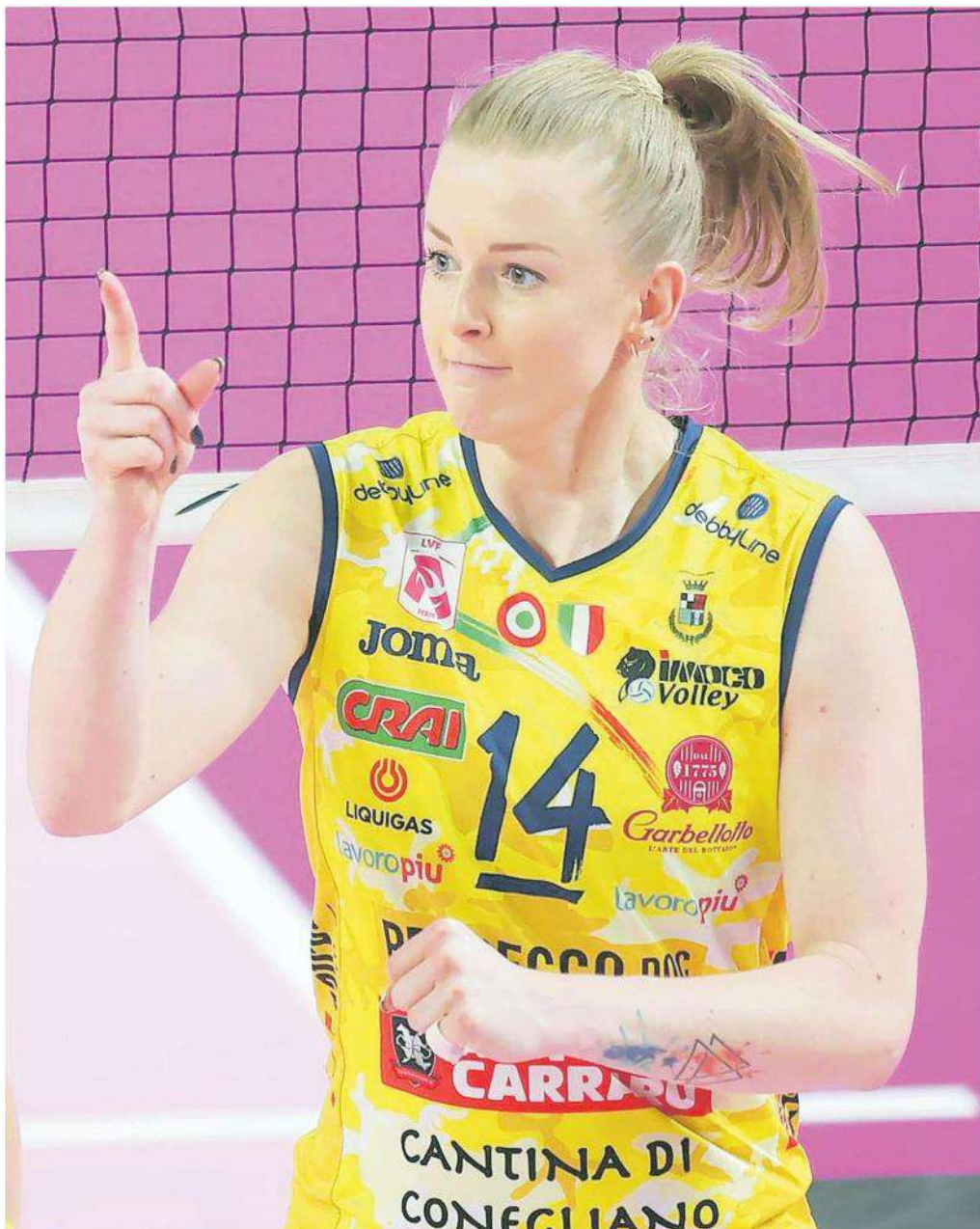
Asia Wolosz, capitano della Prosecco Doc Imoco, considerata la miglior palleggiatrice del pianeta

Ritaglio Stampa ad uso esclusivo del destinatario. Non riproducibile