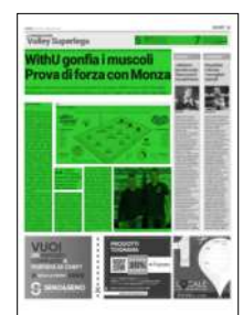
Superficie 38 %

7 Dalla quinta in classifica, Cisterna, alla undicesima, Taranto, ci sono sette squadre racchiuse in solo 4 punti