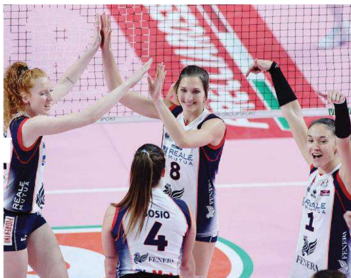
Le giocatrici di Chieri esultano dopo il punto che ha decretato il successo con Novara.