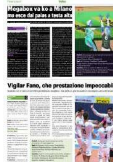
Megabox va ko a Milano ma esce dal palas a testa alta

Data: 13.11.2022 Pag.: 36 Size: 342 cm2 AVE: € 6840.00 Tiratura: Diffusione: Lettori: