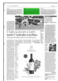
Superficie 3 %

ARTICOLO NON CEDIBILE AD ALTRI AD USO ESCLUSIVO DEL CLIENTE CHE LO RICEVE - 4 - L.1744 - T.1744