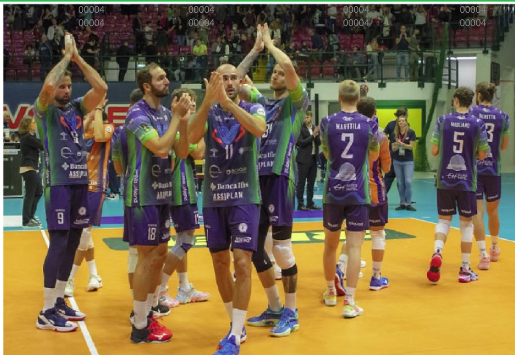
I giocatori del Vero Volley salutano i tifosi. Sopra il titolo a sinistra l'esultanza dopo un set vinto, a destra coach Eccheli incita la squadra