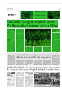
Superficie 36 %