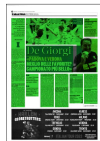
Superficie 68 %

Adesso che la parte più facile del lavoro è stata fatta - scherza De Giorgi - vincere il Mondiale, quella che sto vivendo è la parte più complicata. Sia chiaro ho sperato di viverla, sono contento di essere stato invitato in alcune trasmissioni calcistiche. Sono