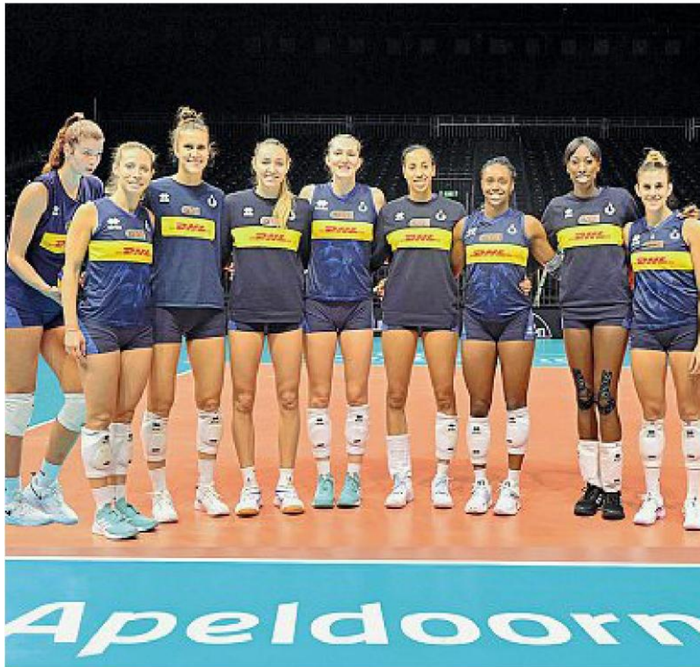
Ad Apeldoorn Da sinistra le 9 (su 14) che hanno giocato nel Club Italia nel palasport delle finali: Cristina Chirichella, Ofelia Malinov, Anna Danesi, Elena Pietrini, Marina Lubian, Sara Bonifacio, Sylvia Nwakalor, Paola Egonu, Alessia Orro