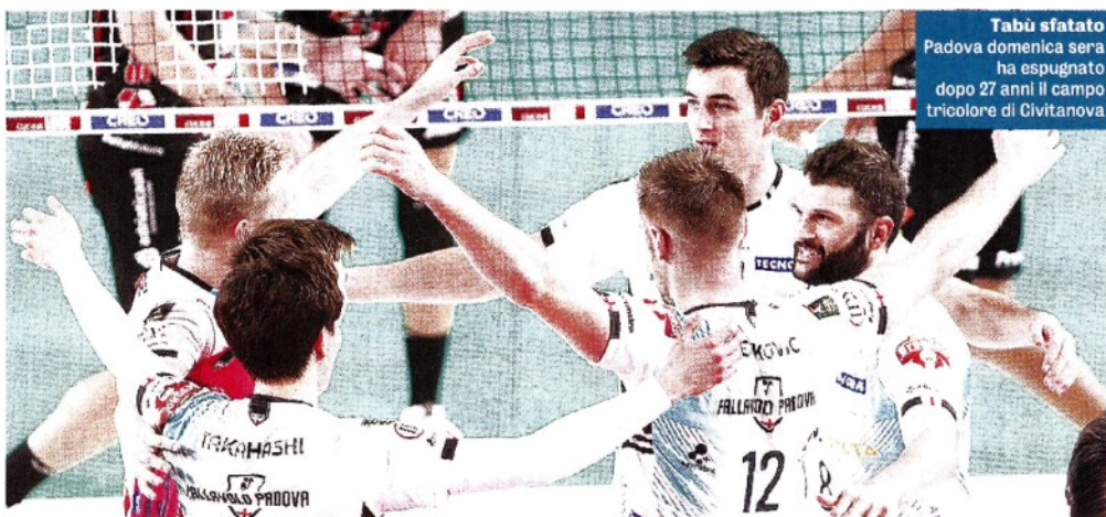
Tabù sfatato Padova domenica sera ha espugnato dopo 27 anni il campo tricolore di Civitanova

ARTICOLO NON CEDIBILE AD ALTRI AD USO ESCLUSIVO DEL CLIENTE CHE LO RICEVE - 4 - L.1744 - T.1744