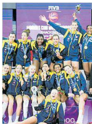
La vittoria del Mondiale 2019

Dopo la vittoria in Cina nel dicembre 2019 e la finale dell'anno scorso a Istanbul, le Pantere potrebbero avere una terza occasione per salire sul trono planetario della pallavolo riportando il loro nome nell'albo d'oro. Le incertezze sono legate alla formula e alle modalità di invito. Se nel 2021, in qualità di campionesse d'Europa in carica, capitano Włosz e compagne erano certe della partecipazione alla kermesse, stavolta (come già avvenuto tre anni fa) servirà una wild card. Stando alle recenti indiscrezioni, si tratterebbe di una mera formalità giacché l'Italia dovrebbe godere non solo della presenza della società organizzatrice ma anche di una seconda formazione. E visti i risultati recenti – campionesse nazionali in carica,