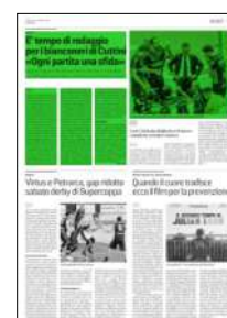
Superficie 36 %

ARTICOLO NON CEDIBILE AD ALTRI AD USO ESCLUSIVO DEL CLIENTE CHE LO RICEVE - 4