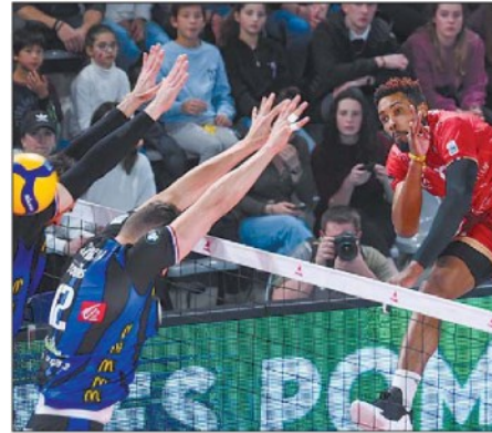
Braccio pesante Herrera nazionale cubano

ARTICOLO NON CEDIBILE AD ALTRI AD USO ESCLUSIVO DEL CLIENTE CHE LO RICEVE - 4