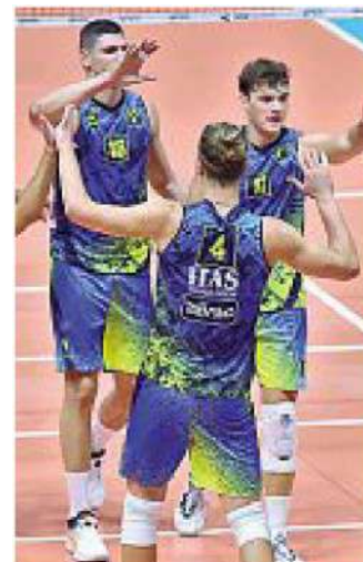
In forma L'Itas cresce

ARTICOLO NON CEDIBILE AD ALTRI AD USO ESCLUSIVO DEL CLIENTE CHE LO RICEVE - 4