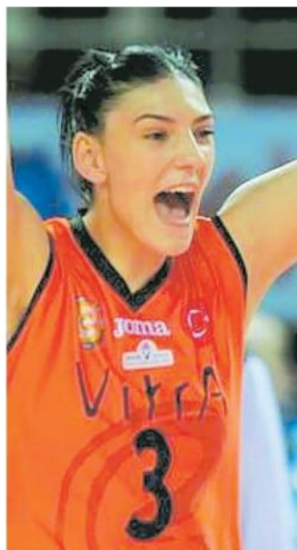
Tijana Boskovic dell'Eczacibasi

Ritaglio Stampa ad uso esclusivo del destinatario. Non riproducibile