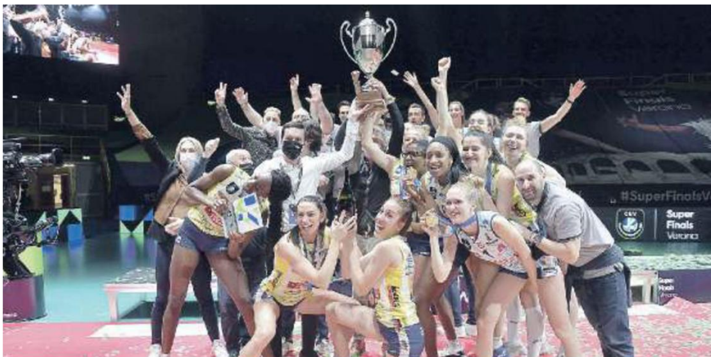
IL TRIONFO Verona 2021 l'Antonio Carraro Imoco alza il trofeo. Le pantere punteranno al riscatto dopo il ko di Lubiana contro il Vakif

Ritaglio Stampa ad uso esclusivo del destinatario. Non riproducibile