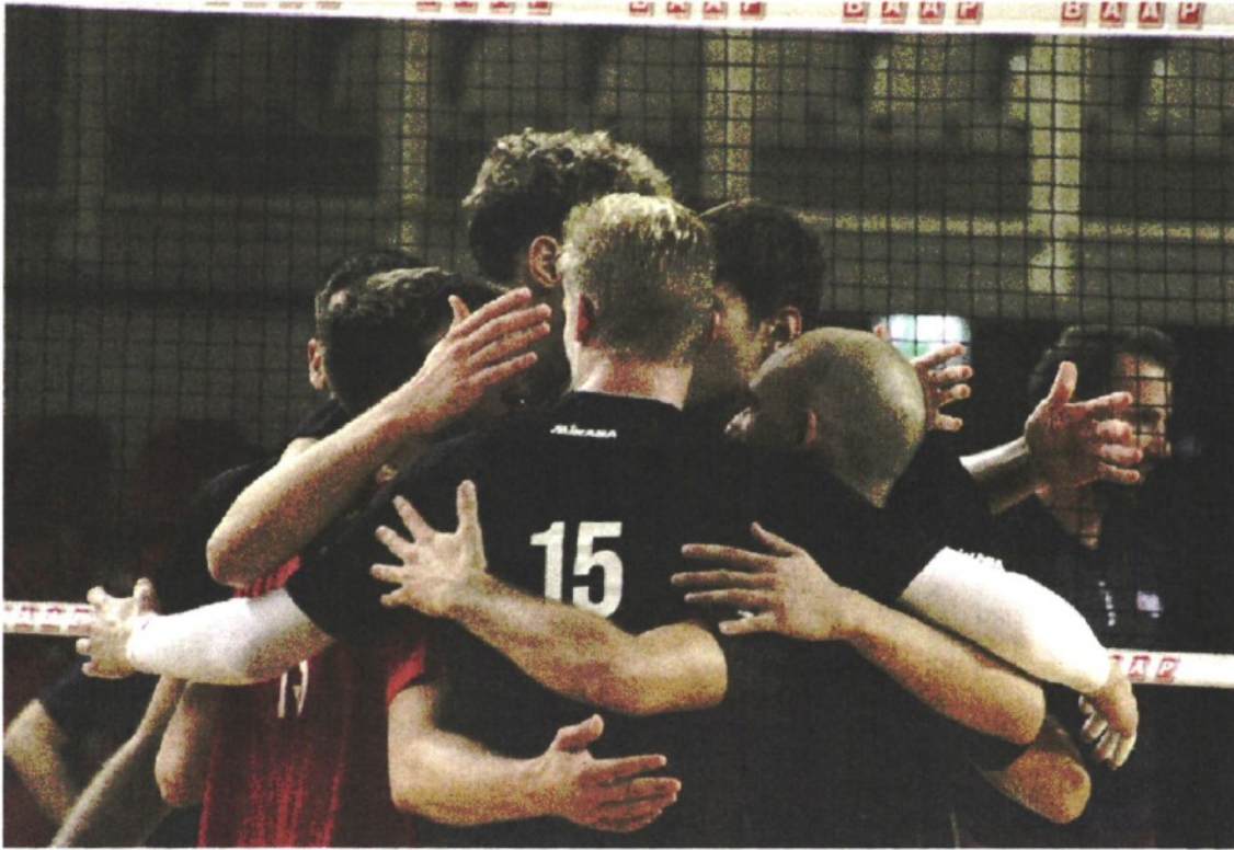
L'AMICHEVOLE I bianconeri sono in piena preparazione, al San Lazzaro hanno dato buone indicazioni

ARTICOLO NON CEDIBILE AD ALTRI AD USO ESCLUSIVO DEL CLIENTE CHE LO RICEVE - 4