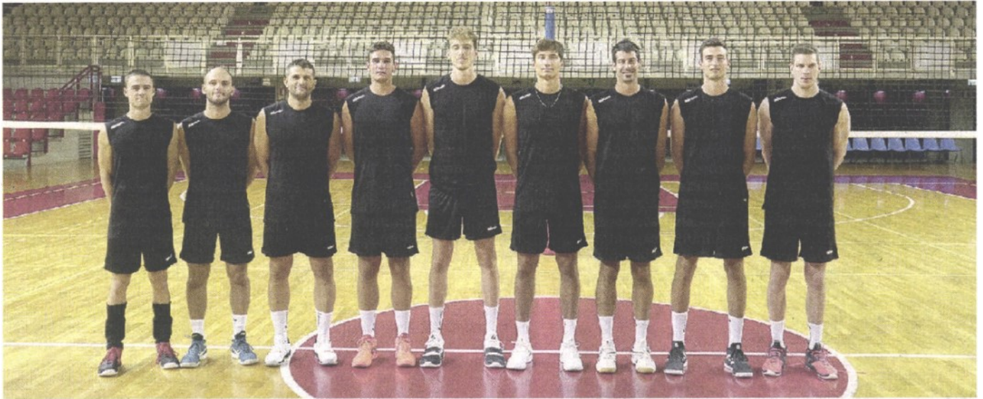
A RANGHI RIDOTTI La preparazione della Pallavolo Padova prosegue, il gruppo attende l'arrivo dei giocatori impegnati nel mondiale

ARTICOLO NON CEDIBILE AD ALTRI AD USO ESCLUSIVO DEL CLIENTE CHE LO RICEVE - 4