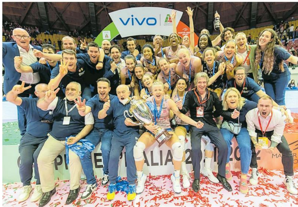
La festa della Prosecco Doc Imoco per la conquista dell'ultimo scudetto all'Arena di Monza

sono certo che ci sarà una gran risposta già dall'esordio casalingo, sarebbe bellissimo iniziare con un bel pieno. Il livello delle squadre si è alzato, mi aspetto sorprese e trabocchetti ad ogni giornata, avere l'arma in più del nostro pubblico al Palaverde sarà per noi fondamentale». —