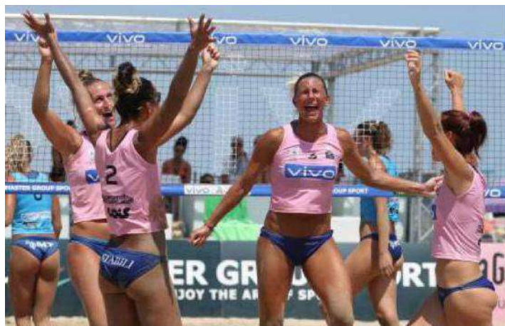
In alto la Vbc Stabili Impresa Costruzioni Casalmaggiore al completo nella tappa di San Benedetto. A sinistra l'esultanza della Vbc Casalmaggiore dopo la vittoria in semifinale. A destra un attacco di Angelina

za, già vincitrice della Coppa Italia settimana scorsa, che ha liquidato Busto Arsizio per 2-0 mentre Zago e compagne hanno dovuto faticare con San Giovanni Marignano spuntandola al terzo set. Nella finalissima Monza è partita alla grande imponendo a Casalmaggiore un passivo severo nel primo parziale, chiuso 8-15. Caracuta ha armato la rimonta della Vbc in un secondo set vibrante (16-14) ma le brianzole hanno poi acceso il turbo e si sono prese lo scudetto sul 7-15 del terzo set.