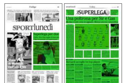
Superficie 101 %