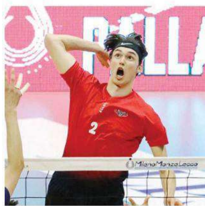
Magliano, 17 anni, giocherà la prossima stagione in Superlega (VERO VOLLEY)