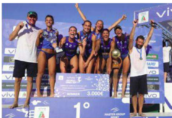
Le campionesse monzesi

Ora per la Vero Volley c'è l'ultimo appuntamento dell'edizione 2022, in programma il prossimo weekend a San Benedetto del Tronto, dove verrà assegnato la Scudetto di Sand Volley 4X4.