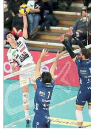
Micheletto contro il muro modenese

TRENTO - Durante la preparazione l'Igas Trentino parteciperà anche a un quadrangolare amichevole a Biella, che la vedrà scendere in campo al Biella Forum. Nel weekend del 24 e 25 settembre i gialloblù contenderanno la vittoria del torneo «Volley sotto il mucrone» a Vero Volley Monza, Modena e Cucine Lube Civitanova. Il programma della due giorni prevede le semifinali sabato 24 alle ore 17 e alle ore 20 e le finali domenica 25 alle ore 15 (3°-4° posto) e alle ore 18 (1°-2° posto). Già aperta la prevendita online dei biglietti su Vivaticket al link diretto www.vivaticket.com/it/Ticket/volley-sotto-il-mucrone-abbonamento/185844 .