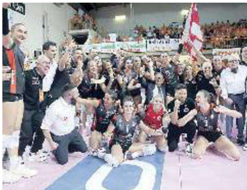
La gioia della Cbf Balducci per la promozione in Serie A1

Ritaglio Stampa ad uso esclusivo del destinatario. Non riproducibile