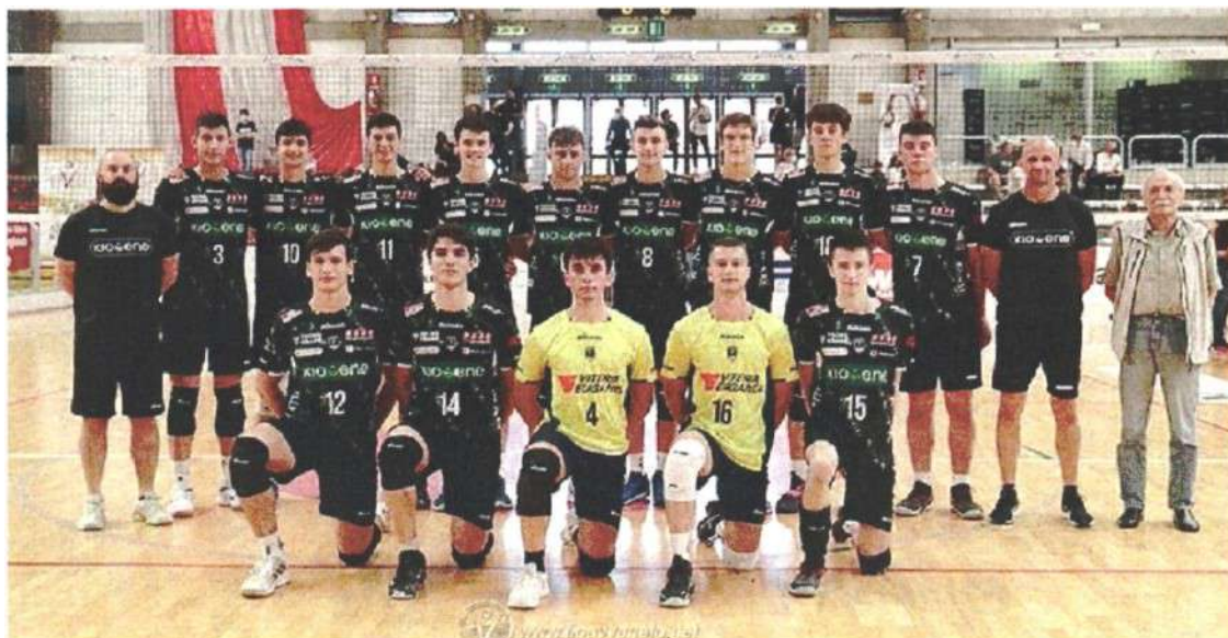
UNDER 19 La squadra ha conquistato il titolo regionale, alla pari dell'Under 17 e dell'Under 12 3x3