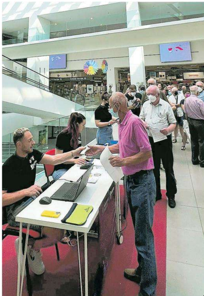
Code al Conè per fare l'abbonamento all'Imoco Conegliano

Ritaglio Stampa ad uso esclusivo del destinatario. Non riproducibile