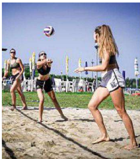
La squadra di Cuneo in allenamento a Lignano Sabbiadoro