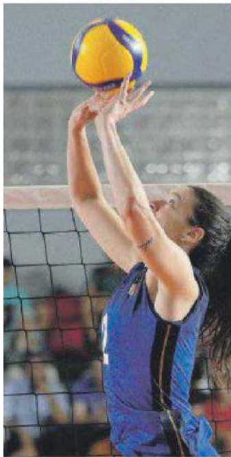
EUROPEI Andria e Cerignola ospiteranno il torneo