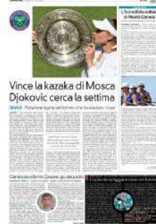
Vince la kazaka di Mosca Djokovic cerca la settima

Data: 10.07.2022 Pag.: 39 Size: 156 cm2 AVE: € 2964.00 Tiratura: Diffusione: 28000 Lettori: