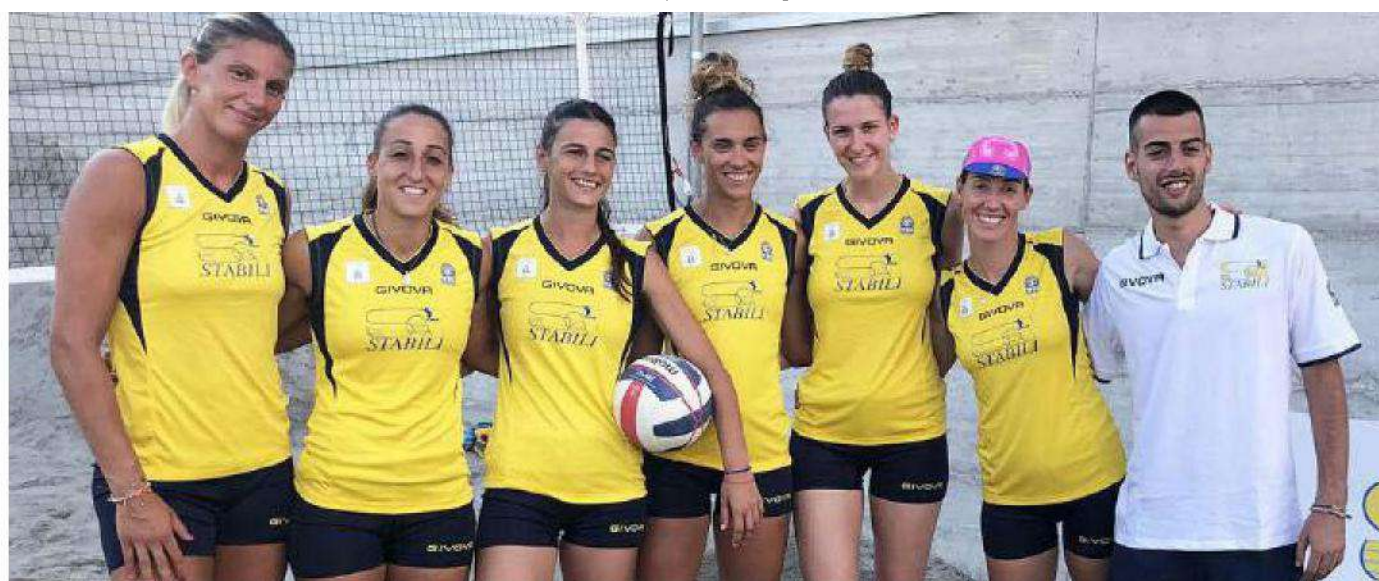
La Stabili Impresa Costruzioni Casalmaggiore pronta per il Legavolley Summer Tour