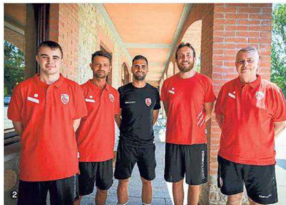
1. Le ragazze che partecipano all'Academy Summer Camp a Dogliani. 2. Lo staff tecnico della Cuneo Granda Volley A1 femminile. 3. Le attività dell'Academy con gli allenamenti in palestra