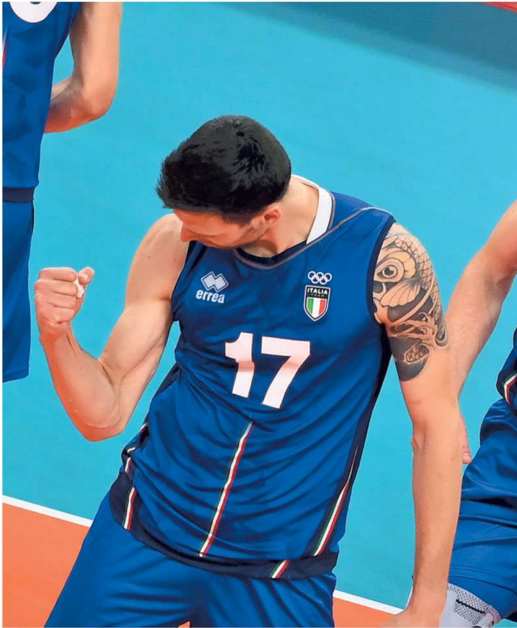
L'Italia maschile ha vinto gli Europei nel 2021 per la settima volta

ARTICOLO NON CEDIBILE AD ALTRI AD USO ESCLUSIVO DEL CLIENTE CHE LO RICEVE - 4 - L.1634 - T.1634