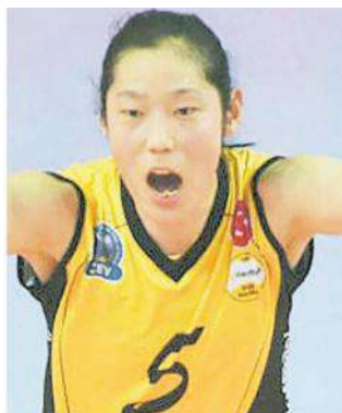
ZHU TING È IL COLPACCIO DELLA SAVINO DEL BENE, SE TORNA IN FORMA È UNA TOP PLAYER MONDIALE

Ritaglio Stampa ad uso esclusivo del destinatario. Non riproducibile