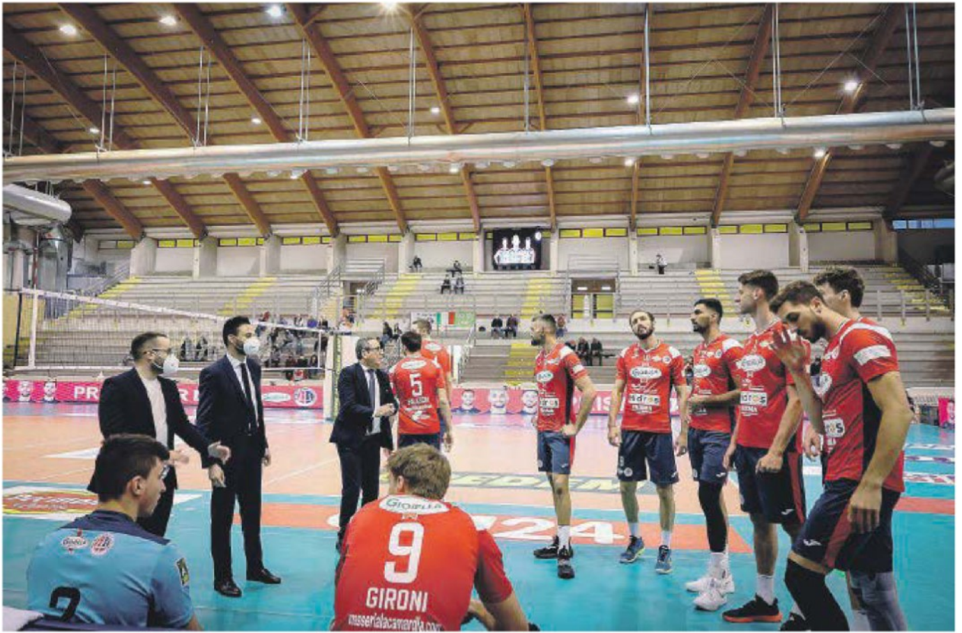
TARANTO I rossoblu hanno conquistato da tempo l'obiettivo stagionale: una storica salvezza