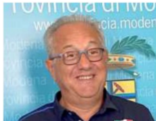
di Gabriele Canovi

«Anche la famiglia Panini lasciò, ma la pallavolo in questa città è sempre rimasta al top»