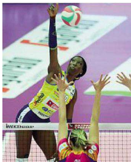
Imoco Stasera la serie scudetto torna al Palaverde

● Palaverde sold out e atmosfera che si annuncia caldissima: la serie è in parità 1-1 dopo le prime due gare.