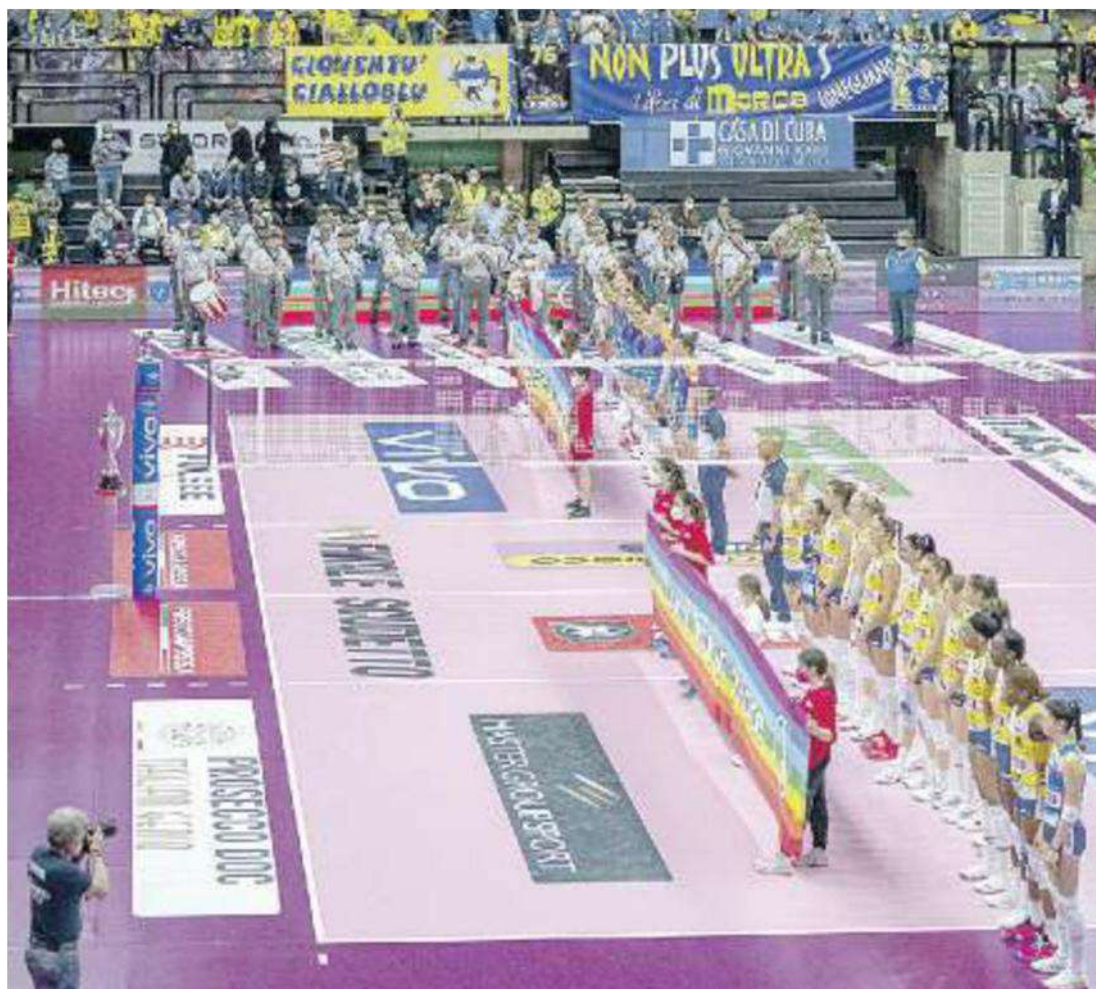
TUTTO ESAURITO La pantere a caccia del 2-1 nella serie che porta al 5° scudetto