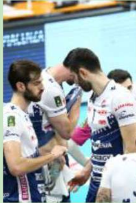
Gli avversari della Bluenergy