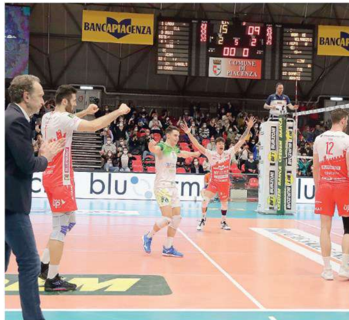
La gioia dei biancorossi dopo la vittoria su Verona una settimana fa

Palasport: Palabanca Sport Arbitri: Caretti e Luciani Inizio: ore 20.30