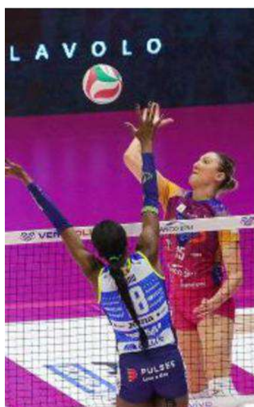
Monza e Conegliano ripartono dall'1-1

sono riservare sorprese. Mi aver lavorato in sala pesi. Il fatto- serlo anche per noi. Conegliano aspetto per questo una gara 3 re campo? Anche nel settore si può battere giocando la mi- tutta da vivere, dopo aver osser- maschile sono arrivate dimo- gliore pallavolo possibile. Servi- vato qualche giorno di riposo, zioni del fatto che non è deter- zio efficace, tanta difesa e mag- soprattutto a livello mentale, e minante: non escludo possa es- giore cinismo nella fasi chiave del match». © RIPRODUZIONE RISERVATA