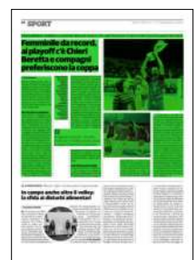
Superficie 46 %

Le ragazze di Gaspari, vincendo anche con il Trentino, hanno chiuso la regular season con 20 successi