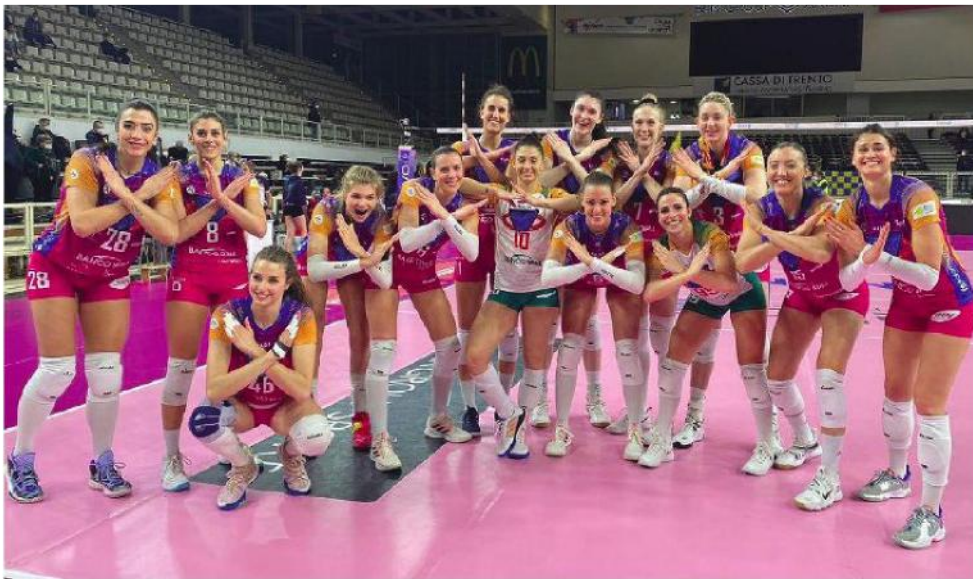
Le ragazze del Vero Volley in posa dopo la vittoria ottenuto sul campo della Trentino

Ritaglio Stampa ad uso esclusivo del destinatario. Non riproducibile