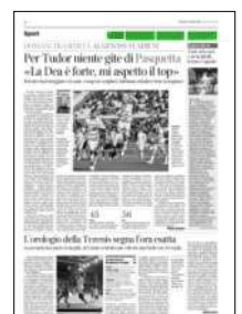
Superficie 1 %

ARTICOLO NON CEDIBILE AD ALTRI AD USO ESCLUSIVO DEL CLIENTE CHE LO RICEVE - 4