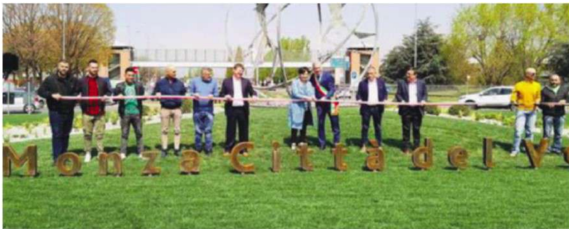
Il taglio del nastro dell'opera voluta dal Consorzio Vero Volley alla rotonda di viale Stucchi

«Il claim "Sport, innovazione e responsabilità sociale" fotografa perfettamente il lavoro quotidiano del Vero Volley. Ecco perché questa realtà in pochi anni è diventata un motivo di orgoglio per tutti noi - ha invece sottolineato il primo cittadino - Monza, ora è davvero per tutti la città del volley».