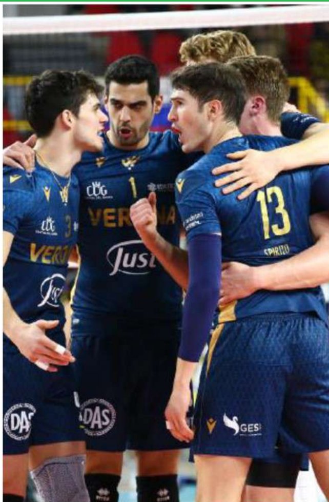
All'assalto Verona cercherà il primo successo di questa fase finale

Con Stefani e l'ex Randazzo sugli scudi, entrambi a segno con venti punti. M.B.