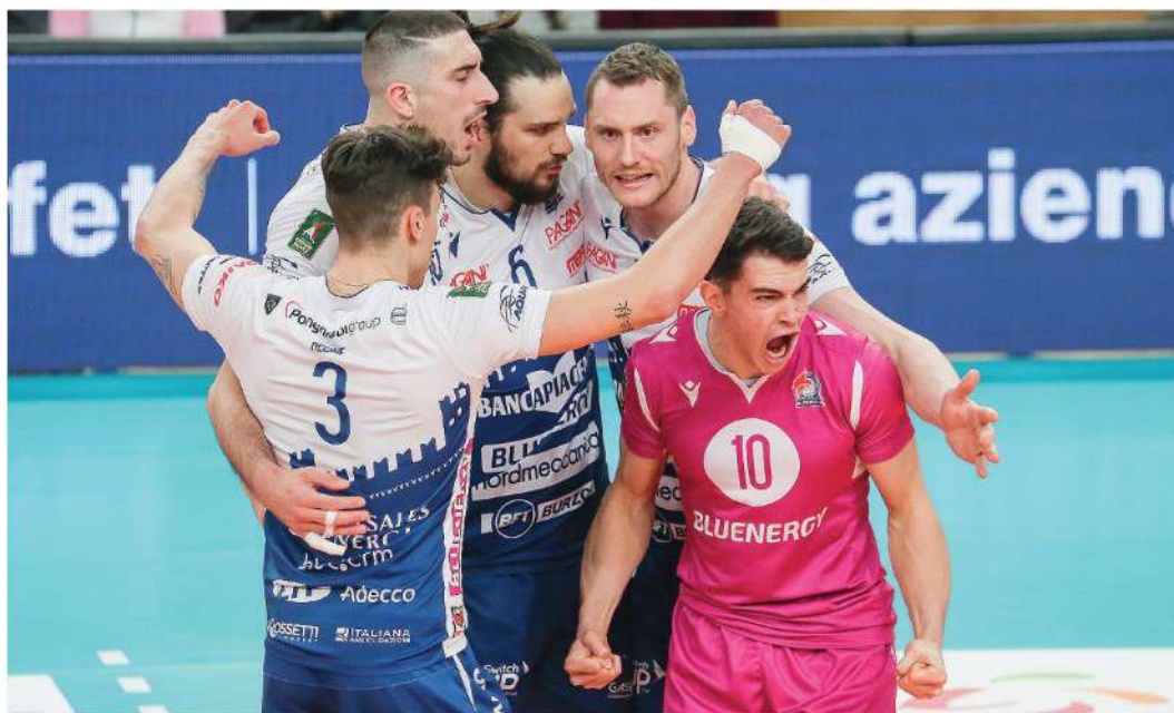
Dopo l'eliminazione con Trento, Piacenza è chiamata a non perdere il treno europeo

Superlega , play off 5° posto - Alle 18, al Palabanca, arriva Cisterna, primo ostacolo del girone a sei. Obiettivo, la Challenge