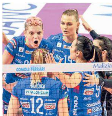
ALLE 18 CONTRO CUNEO