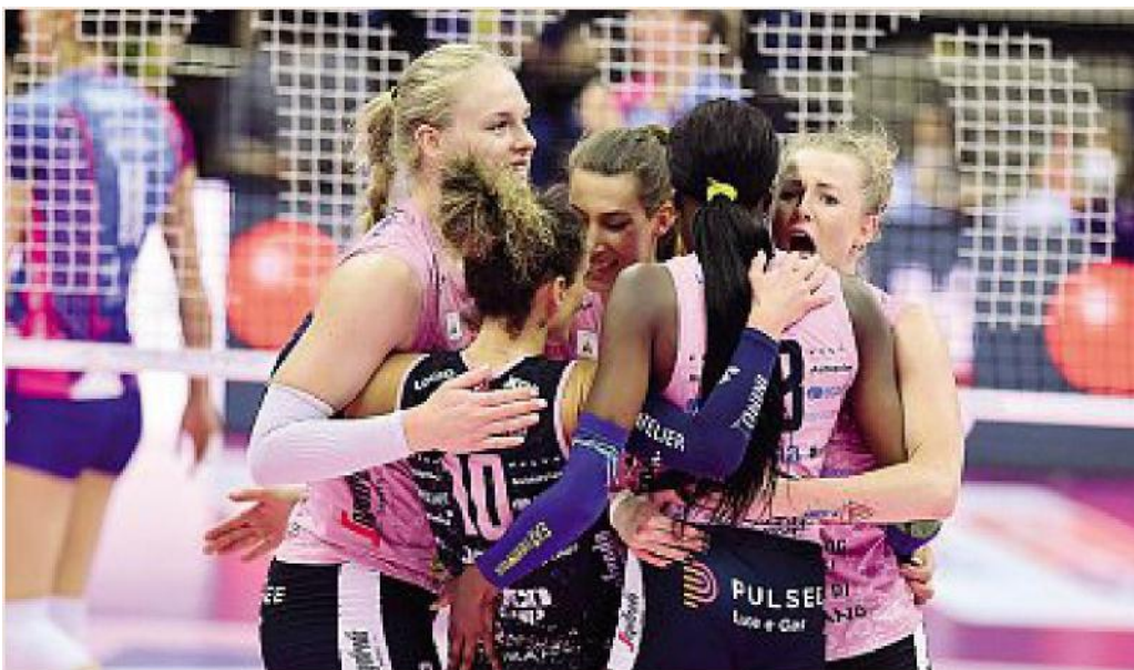
Ultimo gruppo Dopo la sconfitta in gara-1 la Prosecco Doc Conegliano ha invertito la rotta in questa serie GRIGOLIN

il tricolore. Tra l'altro vincere stasera (alle 20.45 in diretta Rai Sport e Sky) vorrebbe avere qualche giorno in più per preparare anche l'ultimo appuntamento europeo. Dopo due gare troppo altalenanti (in casa e poi nei primi due set della seconda sfida, in Brianza) Conegliano ha preso in mano il proprio destino, mostrando al suo pubblico (sold out in Veneto come a Monza) una prova di grande intensità che ha finito per surclassare le ragazze di Gaspari. Il Vero Volley Monza per tornare in Veneto sabato sera deve fare veramente un'impresa, nella sua tanta. Ipotesi non impossibile, visto l'andamento di questi playoff, ma difficilmente pronosticabile dopo quello che si è visto sabato sera in Veneto.