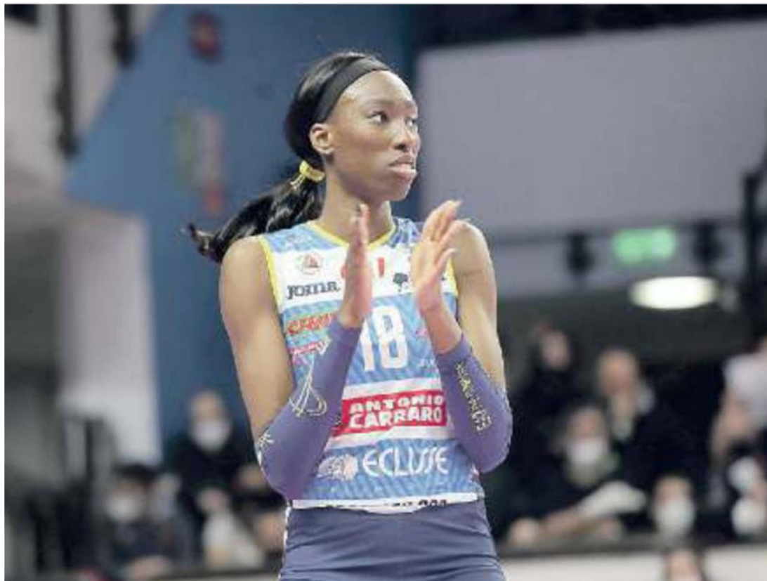
LA REGINA Paola Egonu, trascinatrice delle Pantere del Prosecco Doc Imoco