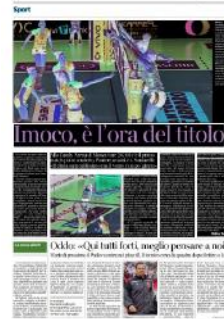
Okke: «Qui tutti forti, meglio pensare a noi»