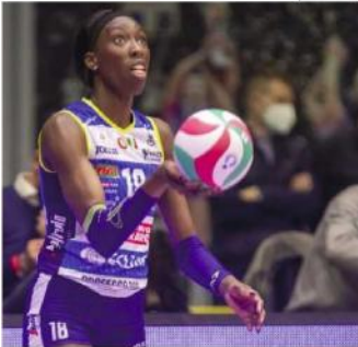
Sotto, Paola Egonu pronta al servizio; la stella della Nazionale ha alzato il livello delle prestazioni

Ritaglio Stampa ad uso esclusivo del destinatario. Non riproducibile