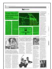
Superficie 35 %

ARTICOLO NON CEDIBILE AD ALTRI AD USO ESCLUSIVO DEL CLIENTE CHE LO RICEVE - 4