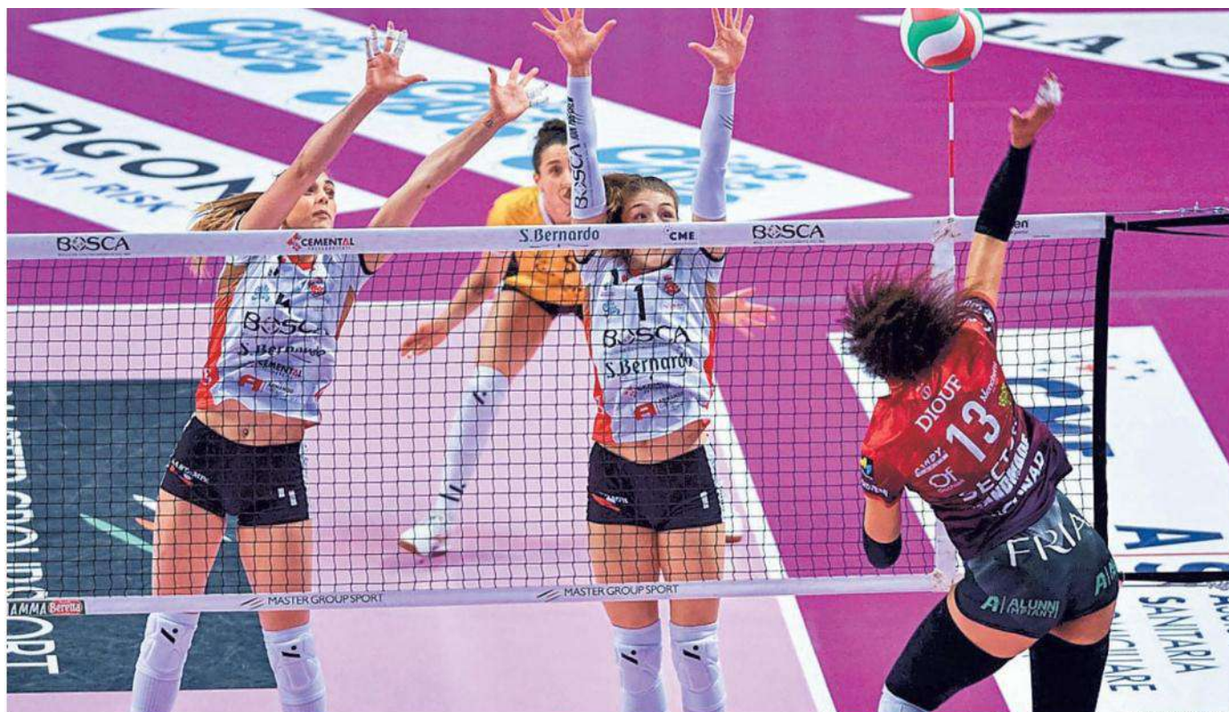
Un'immagine della partita d'andata con Perugia giocata il 18 dicembre al Palazzetto vinta dalle cuneesi al tie-break dopo 2 ore e 22 minuti

per votare la giocatrice che ha più emozionato in questa stagione. La biancorossa che avrà ricevuto il maggior numero di voti verrà premiata dal «main sponsor» Bosca, promotore del sondaggio, prima dell'ultima partita di «regular season» della prossima settimana. —