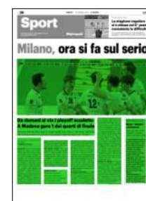
Superficie 64 %