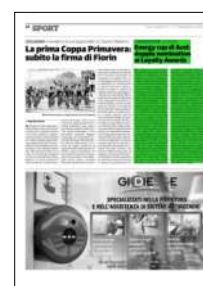
Superficie 14 %

ARTICOLO NON CEDIBILE AD ALTRI AD USO ESCLUSIVO DEL CLIENTE CHE LO RICEVE - 4