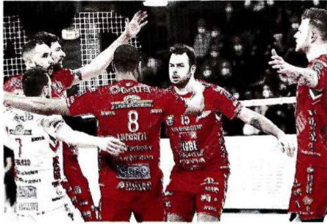
I giocatori della Lube Civitanova dopo un punto segnato