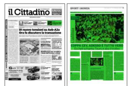
Superficie 79 %

«Una gioia immensa», è il coro unanime di coach, staff e giocatori. «Siamo stati bravi a crederci sino in fondo»