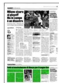
Superficie 12 %

Finale di ritorno: ore 20 Tours-Monza (diretta Eurosport 2). Andata 0-3.