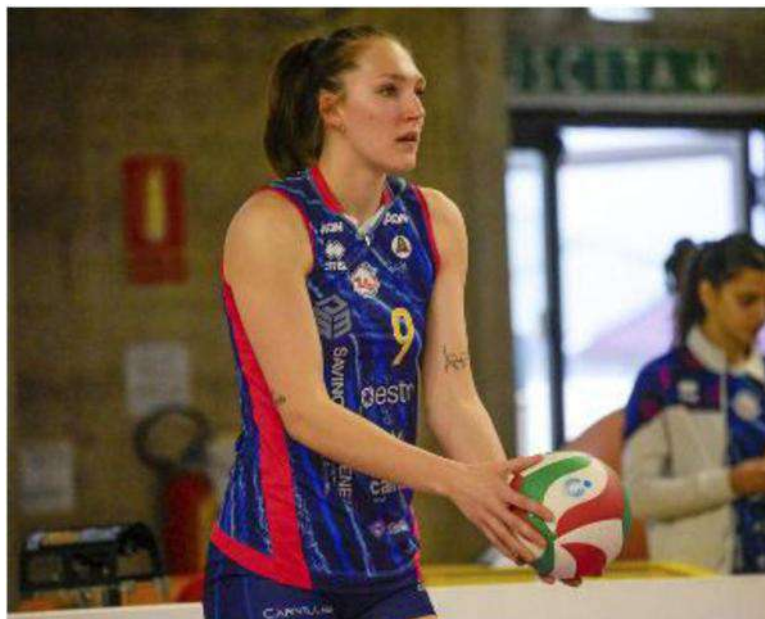
La centrale della Savino Del Bene Marina Lubian

noi, rispettando quello che possono fare loro. Non dobbiamo nasconderci dietro un dito: per il valore tecnico e per il risultato dell'andata partiamo sicuramente da uno step molto più vantaggioso». Ora non resta che giocare. Vai Savino, prenditi la Challenge.