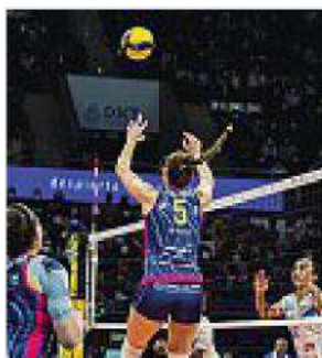
Dominio Un'azione dell'andata