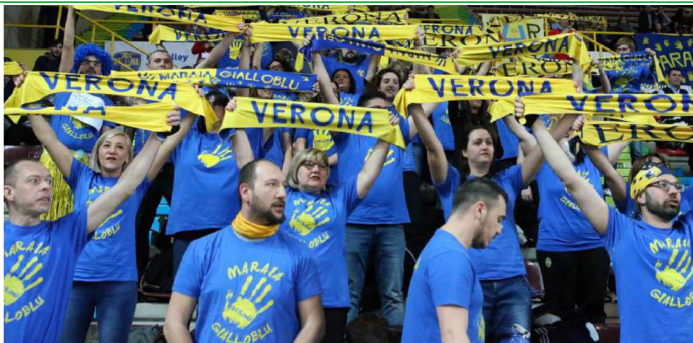
La Maraia Gialloblù non ha mai fatto mancare il proprio sostegno alla squadra, nella buona come nella cattiva sorte. E domani come sempre si farà sentire con i cori e sui tamburi

ARTICOLO NON CEDIBILE AD ALTRI AD USO ESCLUSIVO DEL CLIENTE CHE LO RICEVE - 4