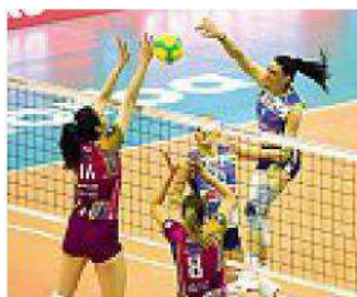
Imoco Battuta ancora Monza 3-1

L'appuntamento è per il 23 maggio. Il luogo e l'avversario sono ancora da definire. Ma sicuramente l'Imoco sarà protagonista della finale di Champions League. Per la quarta volta nella sua storia, la società gialloblù proverà a vincere il titolo continentale più prestigioso, difendendo quello conquistato l'anno scorso a Verona contro il Vakif. E potrebbero essere proprio le turche, attese dal derby di