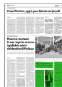
Superficie 13 %

Classifica: Sir Safety Perugia 64, * Lube Civitanova 54, Itas Trentino 53, Leo Shoes PerkinElmer Modena 48, *Allianz Milano 38, Gas Sales Piacenza 34, Vero Volley Monza 31, Top Volley Cisterna 27, Gioiella Prisma Taranto 26, Kioene Padova 24, Verona 24, Callipo Vibo Valentia 22, Consar Ravenna 2. (*1 incontro in meno; ** 1 partita in più).