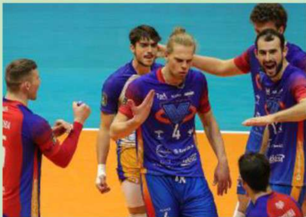
Il Vero Volley Monza festeggia un punto