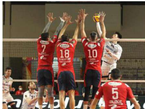
Comunque vada il match con Taranto, Milano è certa della quinta posizione

ARTICOLO NON CEDIBILE AD ALTRI AD USO ESCLUSIVO DEL CLIENTE CHE LO RICEVE - 4