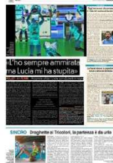
SINCRIO Draghette ai Tricolori, la partenza è da urlo