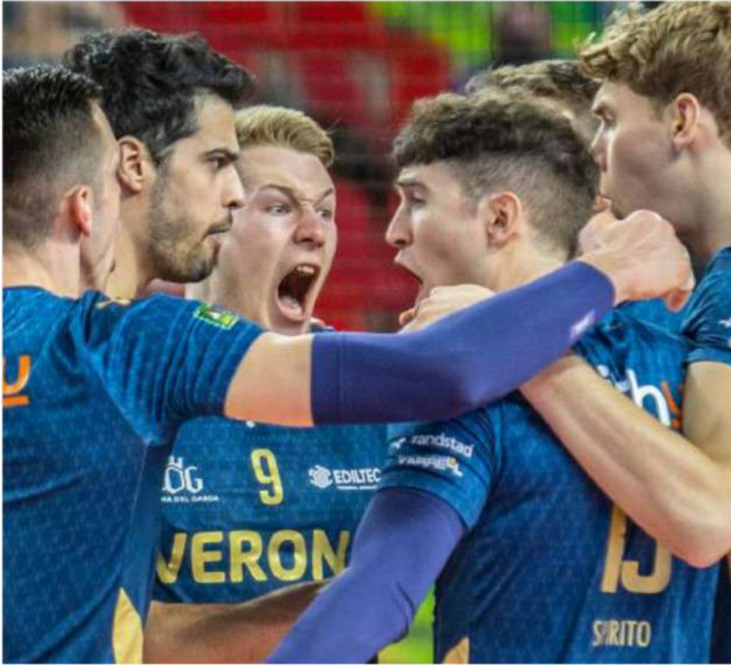
Questa sera contro Monza servirà tanta grinta e molta qualità