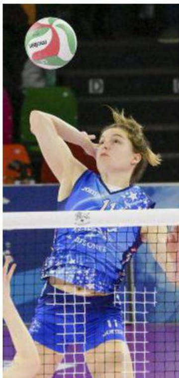
La centrale olandese Belien

Ritaglio Stampa ad uso esclusivo del destinatario. Non riproducibile