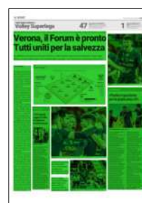
Superficie 77 %

Ma la domanda che tutti si fanno oggi è: ci sarà Mozic? Ha recuperato dall'infortunio alla caviglia rimediato nella gara di sabato scorso contro la Lube? "Ni". Probabile che Stoytchev lo schieri, forse anche fin dall'inizio, ma di sicuro non sarà al top. Il dolore è ancora piuttosto intenso. Se giocherà dovrà stringere i denti perché gli antidolorifici non saranno sufficienti. Comunque sia, Mozic o meno, Verona dovrà dare il meglio di sé magari anche approfittando di un avversario che in settimana ha vinto la gara di andata della finale di Cev contro il Tours e che più che al sesto posto in regular season sta già guardando alla gara di ritorno di mercoledì in Francia per scrivere il proprio nome nella storia della competizione europea. ●