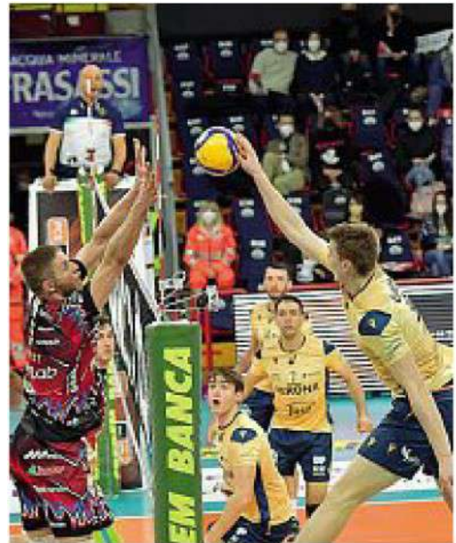
Superlega Verona oggi per l'ultima di stagione regolare

● I gialloblù alle 18 affrontano Monza: serve almeno un punto per non rischiare la discesa in A2.