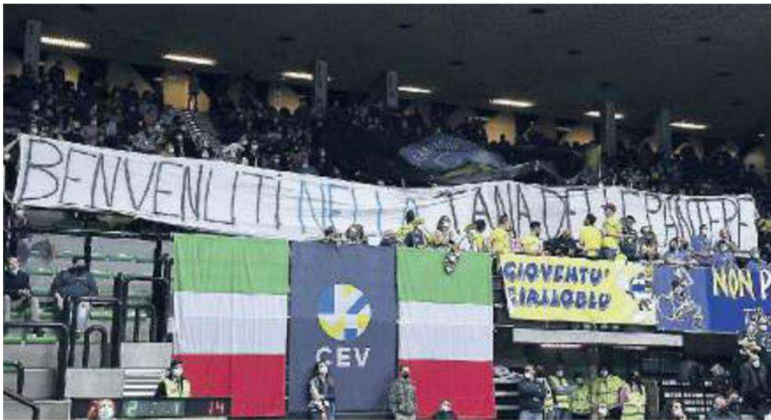
CURVA SUD I supporters gialloblu hanno dato il la ad una serata perfetta e terminata in trionfo

Ritaglio Stampa ad uso esclusivo del destinatario. Non riproducibile