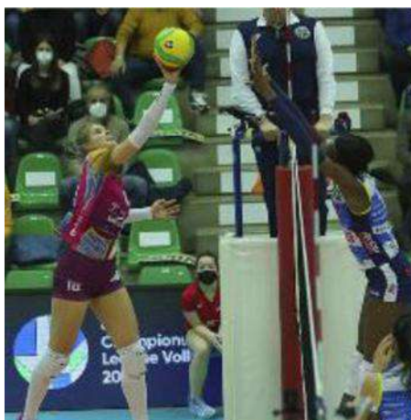
Niente da fare per le Brianzole al PalaVerde

Ritaglio Stampa ad uso esclusivo del destinatario. Non riproducibile