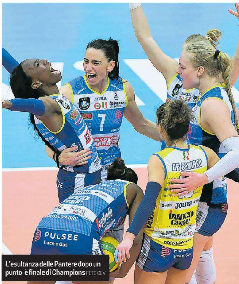
L'esultanza delle Pantere dopo un punto: è finale di Champions