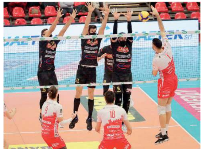
La Gas Sales ritroverà Vibo Valentia domenica alle ore 18

punti, domenica giocherà con Perugia già certa del primo posto e il 23 marzo affronterà Milano nell'ultimo recupero della stagione. La formazione trentina è terza ad una lunghezza da Civitanova ma con una partita giocata in più e domenica viaggerà verso Cisterna con i pontini non solo salvi ma in lotta per conquistare l'ottavo posto in classifica, ultimo valido per accedere ai play off scudetto. E altra cosa certa è che Piacenza qualunque sarà l'avversaria non potrà contare sul fattore campo poiché i quarti di finale si giocheranno al meglio dei tre incontri con la meglio classificata al termine della regular season che giocherà la prima partita e l'eventuale bella in casa. Chi verrà eliminato nei quarti di finale terminerà la corsa verso lo scudetto ma non chiuderà la stagione: andrà a prendere posto nel girone del quinto posto che assegnerà un pass per la Challenge Cup. Ad una giornata dalla fine della stagione regolare, sono dunque ancora tanti i verdeti che devono essere emessi. Domenica al cardiopalma con tutte le squadre in campo alla stessa ora. Sia in chiave play off scudetto con quattro squadre matematicamente ancora in lizza per l'ottavo posto e tra queste anche un paio in lotta per non retrocedere (Verona e Padova), sia in chiave salvezza con Vibo Valentia, Padova e Verona in campo per restare in Superlega.