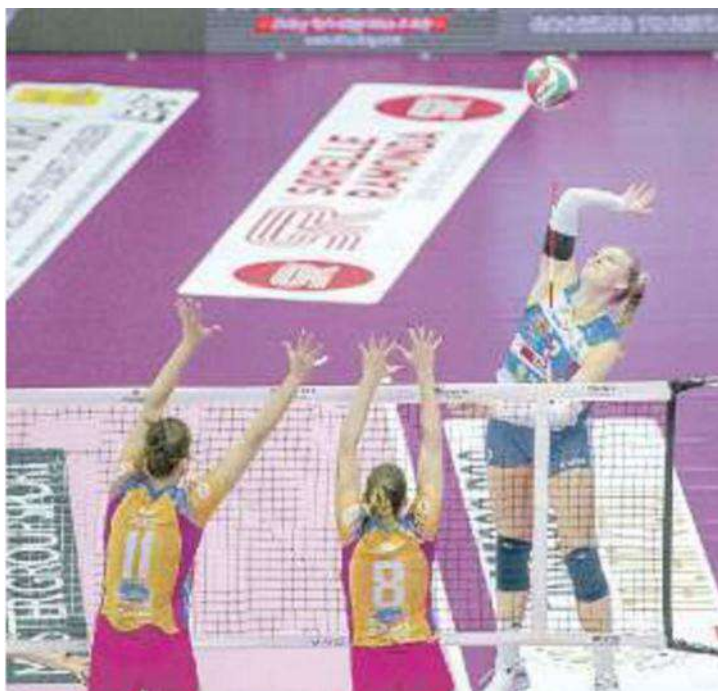
AL PALAVERDE Seconda sconfitta interna per la Prosecco Doc Imoco