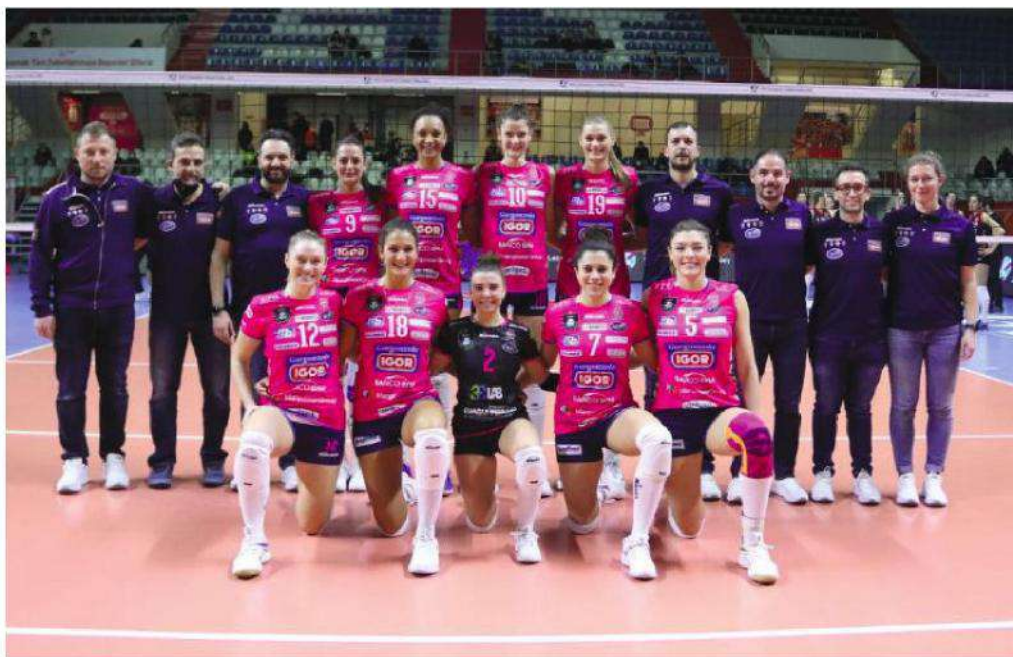
L'ULTIMA SFIDA La squadra scesa in campo a Istanbul con sole 9 giocatrici