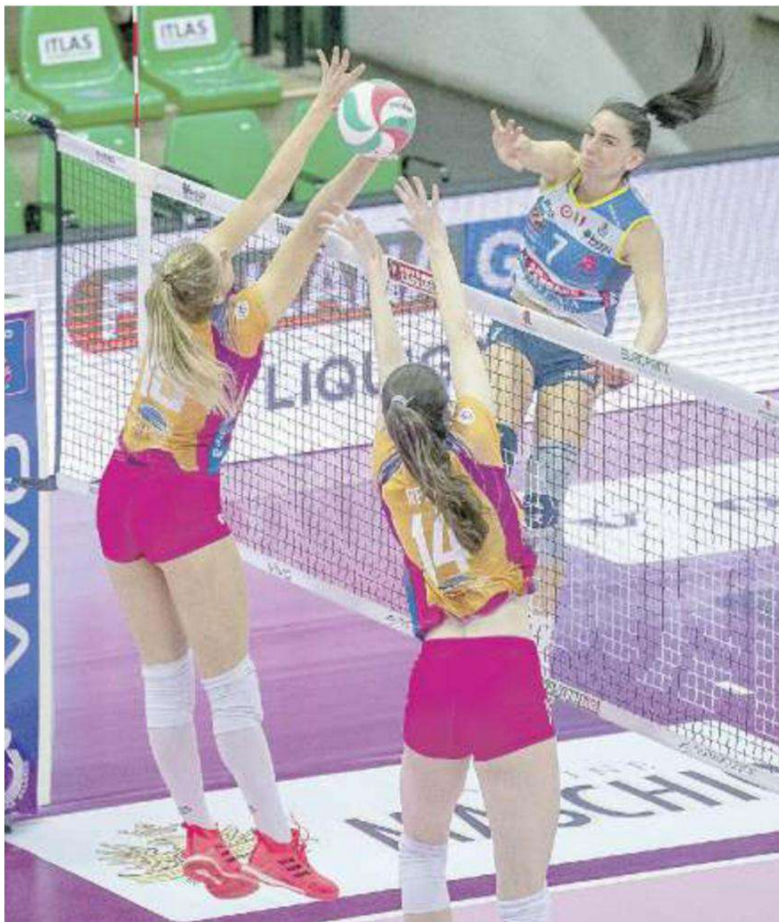
LA CENTRALE Ieri le combinazioni con Wolosz non hanno dato i frutti sperati