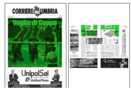
Superficie 117 %