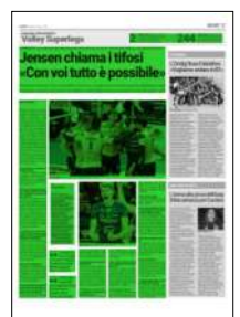
Superficie 55 %

A Padova in trasferta, poi Taranto, Vibo. Non siamo riusciti a giocare.