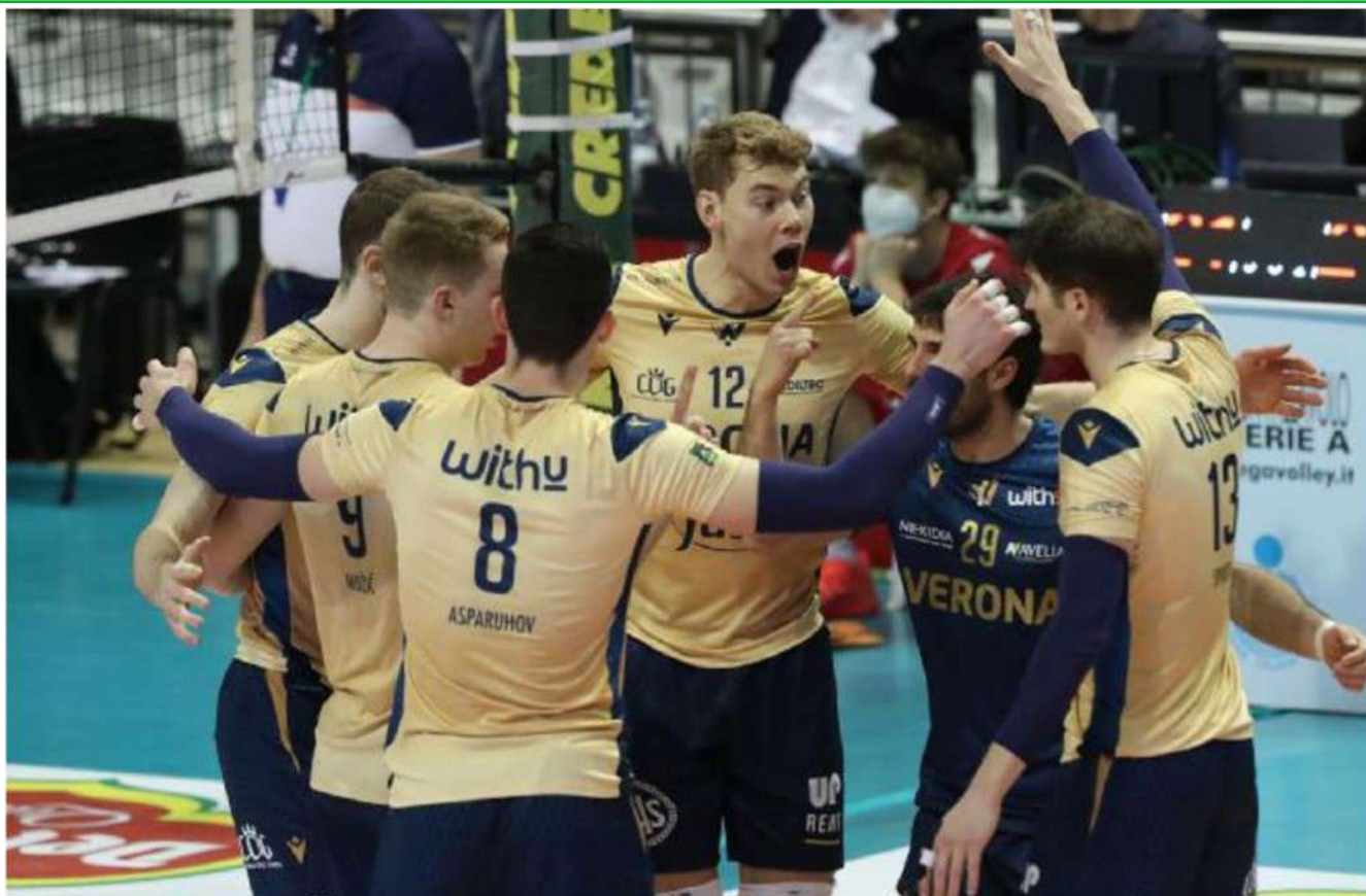
Verona Volley al Forum finora ha perso solo tre volte