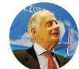
Anche Giacomo Agostini avrà il... suo aereo

[g.m.] Azzurro come il cielo, come le maglie delle Nazionali e come gli aerei di ITA Airways, la nuova compagnia partecipata al 100% dal Ministero dell'Economia e delle Finanze. Un'azienda nata nel 2021, l'anno d'oro dello sport italiano, che ha