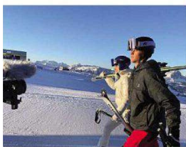
Amici Jannik Sinner, 20 anni, e Lindsey Vonn, 37, a Plan de Corones