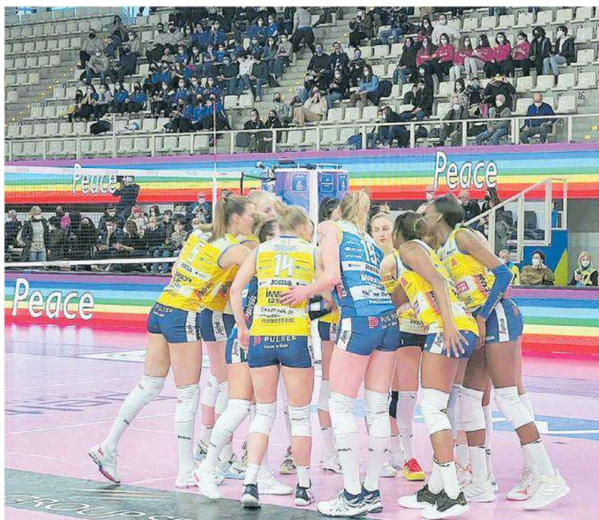
Le ragazze Imoco puntano anche alla Champions

Ritaglio Stampa ad uso esclusivo del destinatario. Non riproducibile