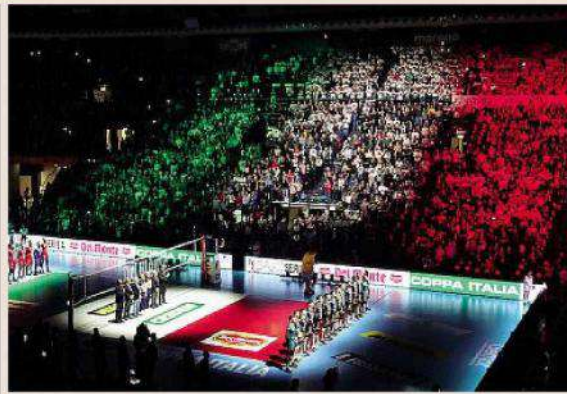
Stesso palazzo La finale di Coppa Italia 2020 prima del lockdown, l'ultima a essere giocata con il pubblico zero