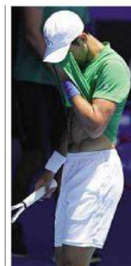
Numero 2 Novak Djokovic, 34 anni, è stato sorpassato in vetta al ranking dal russo Daniil Medvedev