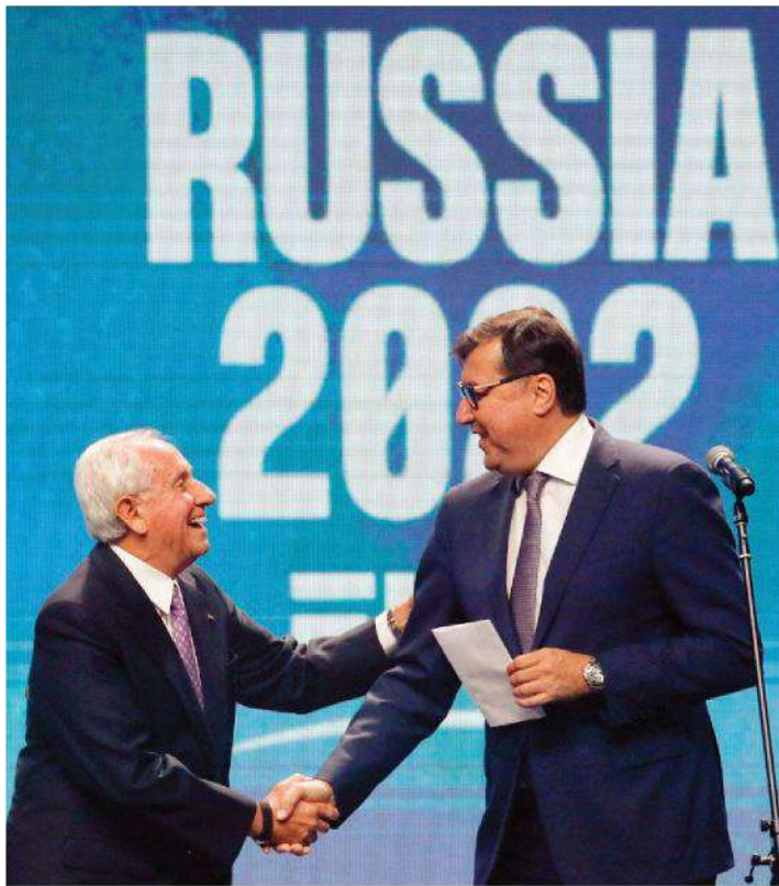
Il presidente Fivb Grasa e il russo Shevchenko all'assegnazione del Mondiale