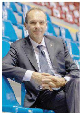
Massimo Righi presidente di Legavolley

«La scelta della CEV», spiega Massimo Righi , presidente della Lega Pallavolo - segue i febbrili contatti di questi giorni. I nostri club erano pronti a ogni soluzione pur di dare un forte segnale nei confronti del conflitto. La campagna di comunicazione contro il conflitto continuerà con la dedica della nostra Final Four di Coppa Italia all'Ucraina, iniziando sabato il nostro evento all'Unipol Arena con l'inno nazionale ucraino».