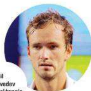
Daniil Medvedev n.1 del tennis

TENNIS. Fuori le squadre ma non i giocatori: Russia e Bielorussia sono state escluse da tutte le competizioni (compresa la Coppa Davis e la Billie Jean King Cup) ma ai tennisti non è vietato competere individualmente nei vari tornei purché non giochino sotto la bandiera del loro paese.