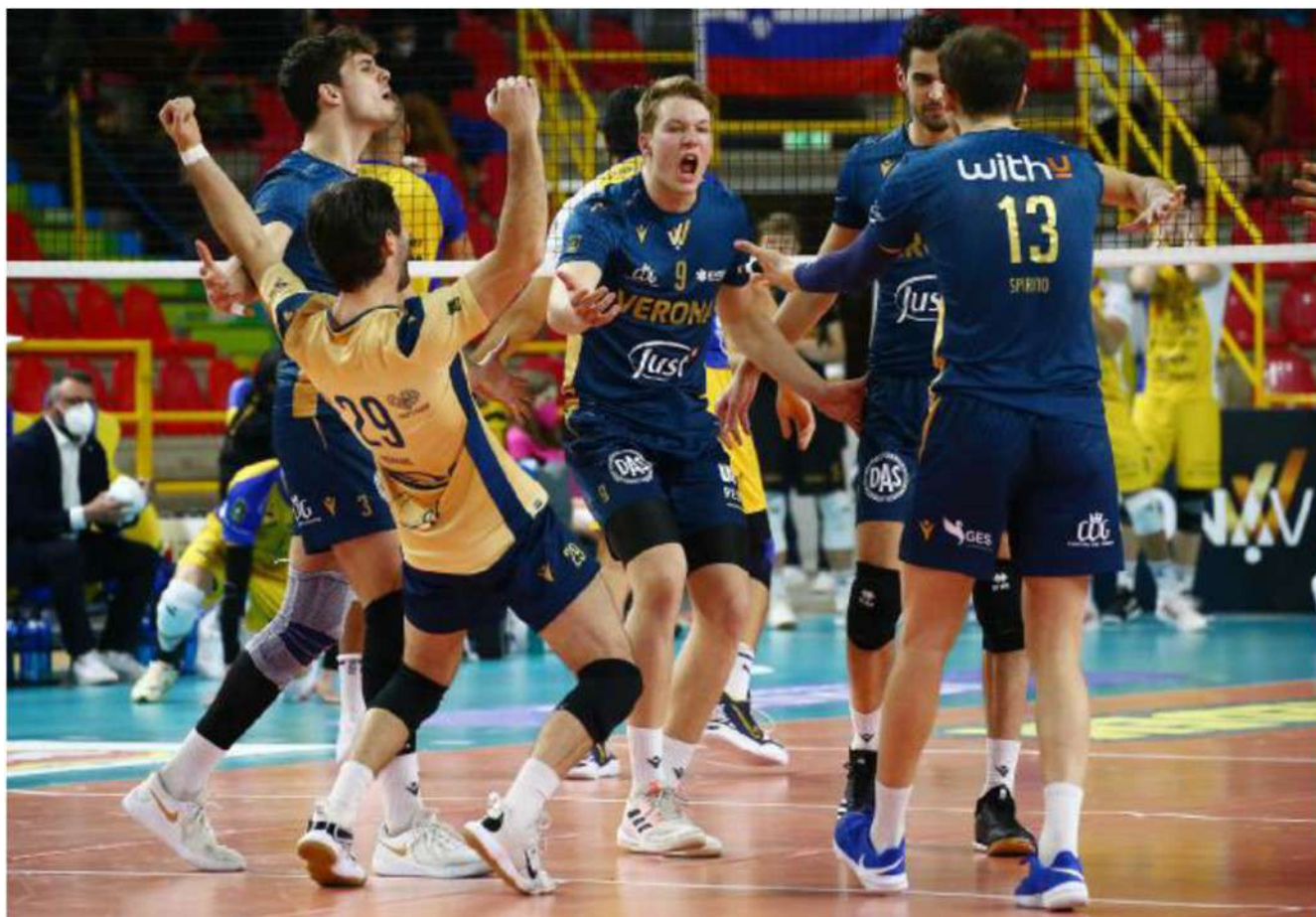
Verona Volley al Forum è un avversario temibile per chiunque. E in casa all'ultima giornata della regular season sfiderà Monza

Campionati del Mondo La Federazione Internazionale ha ufficializzato che la Russia non sarà la sede dei Campionati del Mondo , inizialmente in programma dal 26 agosto all'11 settembre. La decisione è stata presa dal Board della Fivb in accordo con il Comitato organizzatore locale e la Federazione russa di pallavolo perché naturalmente non esistono più i presupposti per l'organizzazione del torneo. La Fivb rende poi noto che è al lavoro per trovare un Paese o più Paesi ospitanti che possano garantire il regolare svolgimento della manifestazione in un clima di pace e gioia. La Fivb ha inoltre confermato che tutte le squadre nazionali, i club, gli ufficiali di gara e gli atleti di beach volley e snow volley russi e bielorusi adesso non sono più idonei a partecipare a tutte le gare internazionali e continentali fino a nuovo avviso.