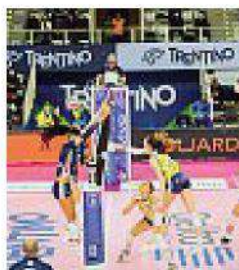
Attacco Le Pantere

Ma sono solo ipotesi sul tavolo, perché al vaglio potrebbe essere pure messa in campo la possibilità di ripescare ai quarti di finale le formazioni estromesse dalla coppa europea nei turni precedenti. Quindi le Pantere, al momento, sanno di giocarsi il quarto contro le brianzole, con l'andata fissata per mercoledì prossimo a Monza e il ritorno in programma giovedì 17 marzo al Palaverde: la testa intanto è al derby.