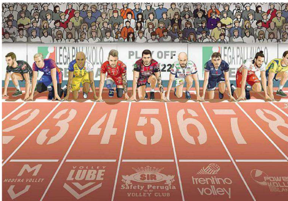
Mitando Jacobs Ultimo mese di Superlega, quello che decreta la seconda squadra a retrocedere, ma che soprattutto determina la griglia dei playoff che iniziano il 27 marzo MACCABONI