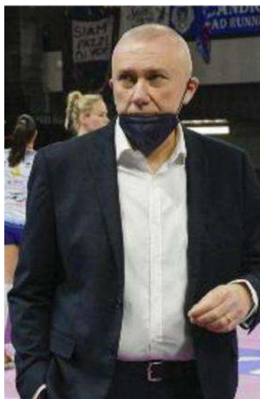
L'allenatore Massimo Barbolini

re. Proprio questo il ko contro n. cas. Roma credo che le renderà ancora più combattive. Sarà una gara veramente difficile. Sono convinto però che la Savino Del Bene sia pronta per questo impegno. Il lavoro fatto in questi giorni è stato buono e sono fiducioso sulla possibilità di raccogliere un risultato positivo».