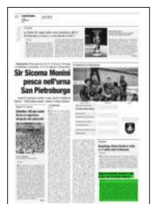
Superficie 4 %

ARTICOLO NON CEDIBILE AD ALTRI AD USO ESCLUSIVO DEL CLIENTE CHE LO RICEVE - 4