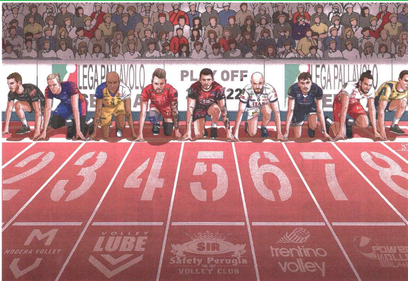
Imitando Jacobs Ultimo mese di Superlega , quello che decreta la seconda squadra a retrocedere, ma che soprattutto determina la griglia dei playoff che iniziano il 27 marzo MACCABONI