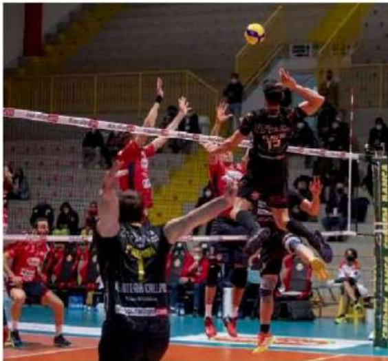
Superlega La Callipo deve provare a racimolare punti

torno si preannuncia intensa per entrambe le contendenti che scenderanno sul taraplex con l'unico obiettivo di conquistare punti importanti anche in considerazione della classifica che si presenta corta. Giunti a questo punto della regular season Soverato deve necessariamente procurare punti per riuscire ad acciuffare la griglia play-off anche in vista dell'ultimo recupero della prossima settimana sempre in trasferta contro Como. Le "piumine", di coach Solforati, dopo un filotto di tre vittorie consecutive ed un turno di riposo sono appollaiate al terzo posto della classifica con un bottino di 36 punti, mentre il sestetto del basso Ionio condotto da Coach Napolitano giunge a Mondovì seduto sul sesto gradino della classifica con venticinque punti. (giu.ran.)