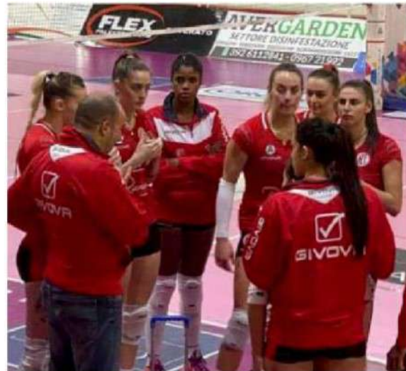
Serie A2 femminile Soverato oggi in anticipo