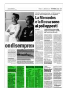
Superficie 17 %

ARTICOLO NON CEDIBILE AD ALTRI AD USO ESCLUSIVO DEL CLIENTE CHE LO RICEVE - 4