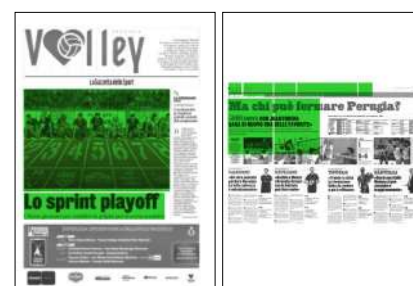
Superficie 197 %

Sono in programma a Bologna le Final Four di Coppa Italia. Semifinali il sabato: Perugia-Piacenza, Trento-Milano. Finale il giorno dopo