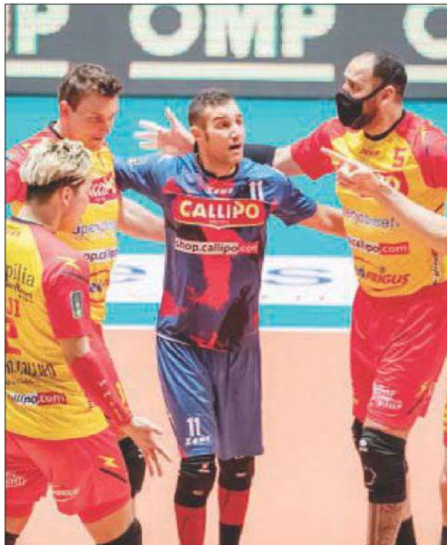
I giallorossi dopo un punto

ARTICOLO NON CEDIBILE AD ALTRI AD USO ESCLUSIVO DEL CLIENTE CHE LO RICEVE - 4