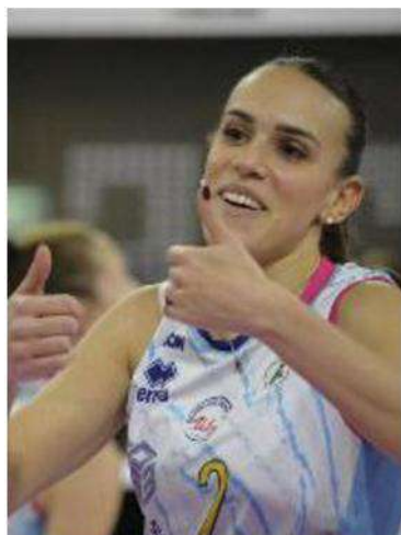
Volley A1 femminile