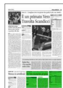
Superficie 10 %

ARTICOLO NON CEDIBILE AD ALTRI AD USO ESCLUSIVO DEL CLIENTE CHE LO RICEVE - 4