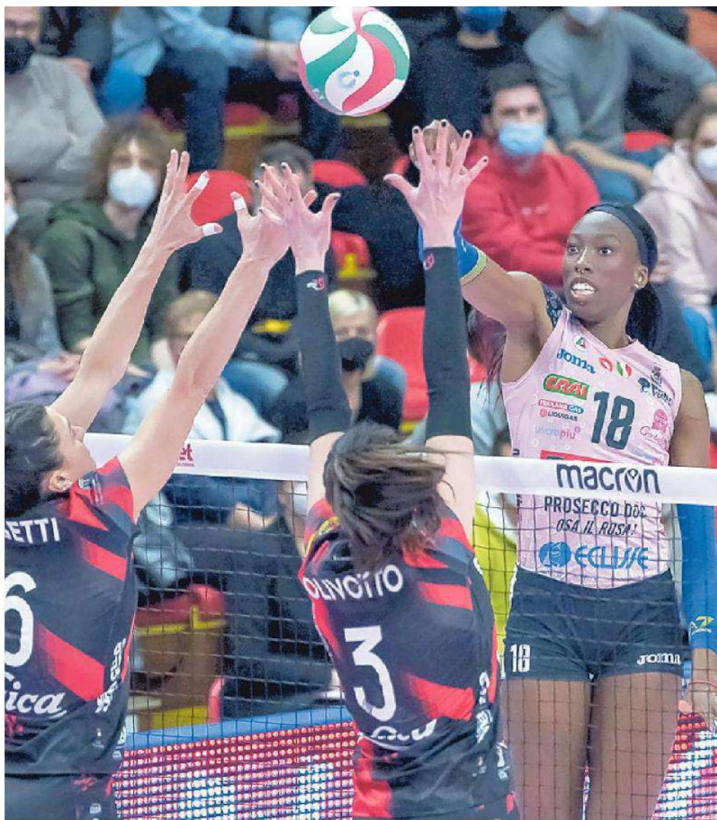
Paola Egonu, la superstar dell'Imoco, supera il muro delle farfalle bustocche

Ritaglio Stampa ad uso esclusivo del destinatario. Non riproducibile