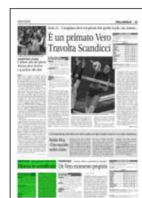
Superficie 5 %

ARTICOLO NON CEDIBILE AD ALTRI AD USO ESCLUSIVO DEL CLIENTE CHE LO RICEVE - 4