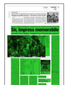
Superficie 57 %