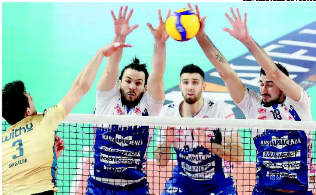
Il muro della Gas Sales Bluenergy in azione contro Verona

classifica a Cisterna che con Milano non si è ripetuta dopo la vittoria infrasettimanale con Piacenza e ha perso seccamente. Calabresi e pontini hanno giocato lo stesso numero di gare e, se finisce adesso la stagione, scenderebbe in A2 proprio Cisterna insieme alla oramai condannata Ravenna che solo la matematica le lascia ancora un luccichino di speranza. Il big match dell'ottava giornata tra Modena e Perugia si è chiuso con la vittoria degli umbri che il Gas Sales Bluenergy affronteranno nel giro di un paio di settimane due volte: mercoledì 23 febbraio a Perugia nel recupero valido per l'undicesima giornata che le altre squadre hanno giocato nel week end del 22 e 23 gennaio e poi sabato 5 marzo all'Unipol Arena di Casalecchio di Reno nella semifinale di Coppa Italia. Domani quella tra Gas Sales Bluenergy e Padova non sarà l'unica gara in programma. Scenderanno in campo, infatti, anche Monza e Ravenna nel recupero della quarta di ritorno e Vibo Valentia con Cisterna, recupero della quinta di ritorno, in una sfida salvezza tutta da vedere.