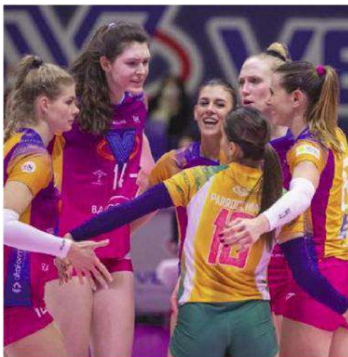
Le ragazze del Vero Volley sono attese in Finlandia