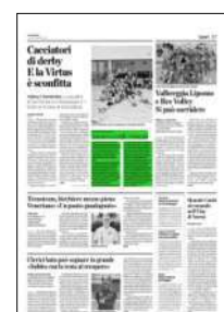
Superficie 5 %

ARTICOLO NON CEDIBILE AD ALTRI AD USO ESCLUSIVO DEL CLIENTE CHE LO RICEVE - 4