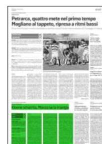
Superficie 16 %

ARTICOLO NON CEDIBILE AD ALTRI AD USO ESCLUSIVO DEL CLIENTE CHE LO RICEVE - 4