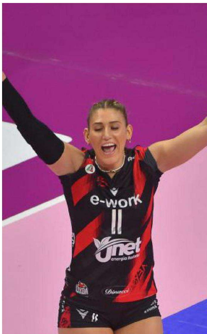
Resta in forse il futuro in maglia Uyba di Mingardi tentata dalle offerte di Vallefoglia e Casalmaggiore

Ritaglio Stampa ad uso esclusivo del destinatario. Non riproducibile