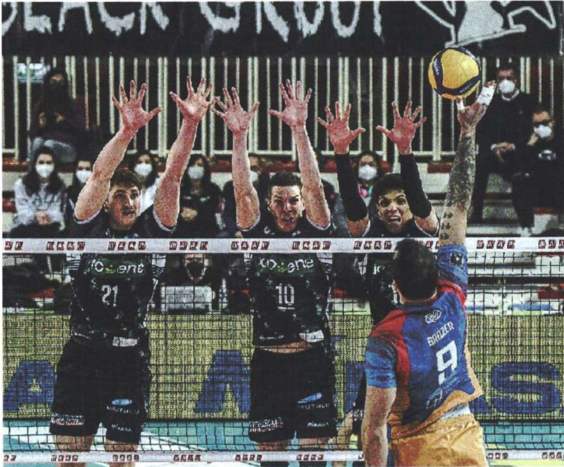
TEMPI DURI La sconfitta con Monza ha reso ancora più complicata la corsa della Kioene verso la salvezza

ARTICOLO NON CEDIBILE AD ALTRI AD USO ESCLUSIVO DEL CLIENTE CHE LO RICEVE - 4