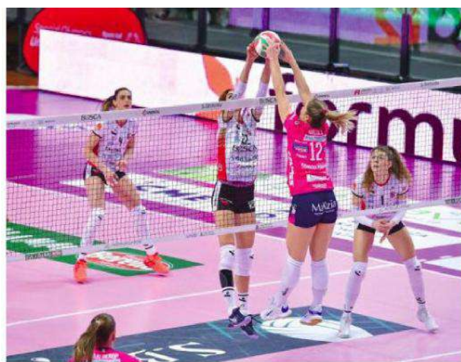
PROTAGONISTE Da sinistra un attacco di Daalderop e una palla contesa di Hancock