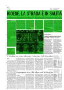
Superficie 35 %