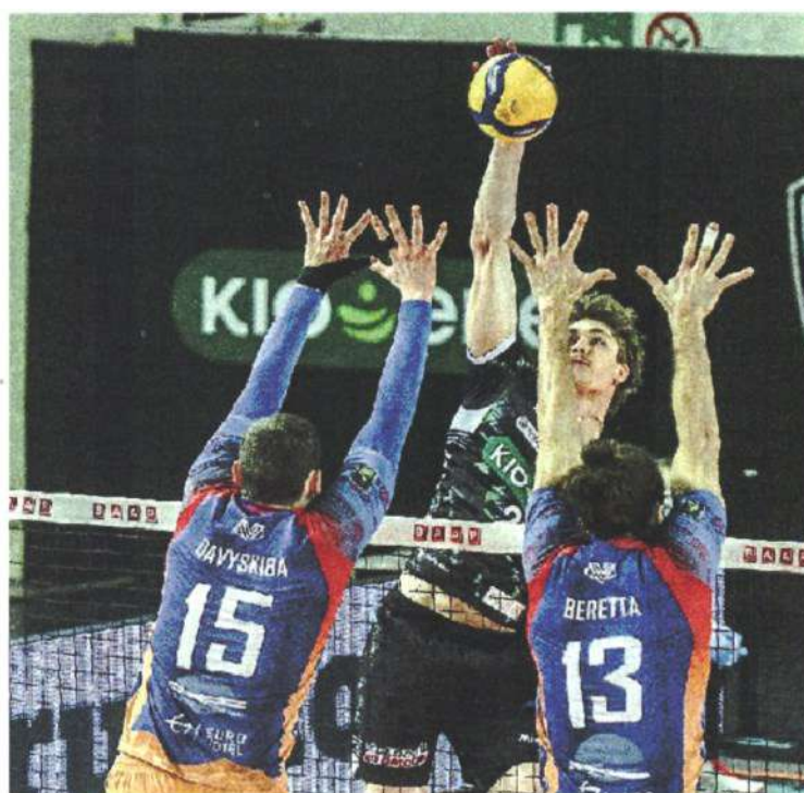
WEBER Tra i pochi a salvarsi in casa bianconera nel grigiore generale

NOTE: spettatori 887, incasso 5.073 euro. Durata set: 25', 25', 28'; totale: 1h e 18'. Padova: battute sbagliate 13, vincenti 4, muri 5, errori 19. Monza: b.s. 16, v. 8, m. 5, e. 18. Mvp: Dzavoronok.