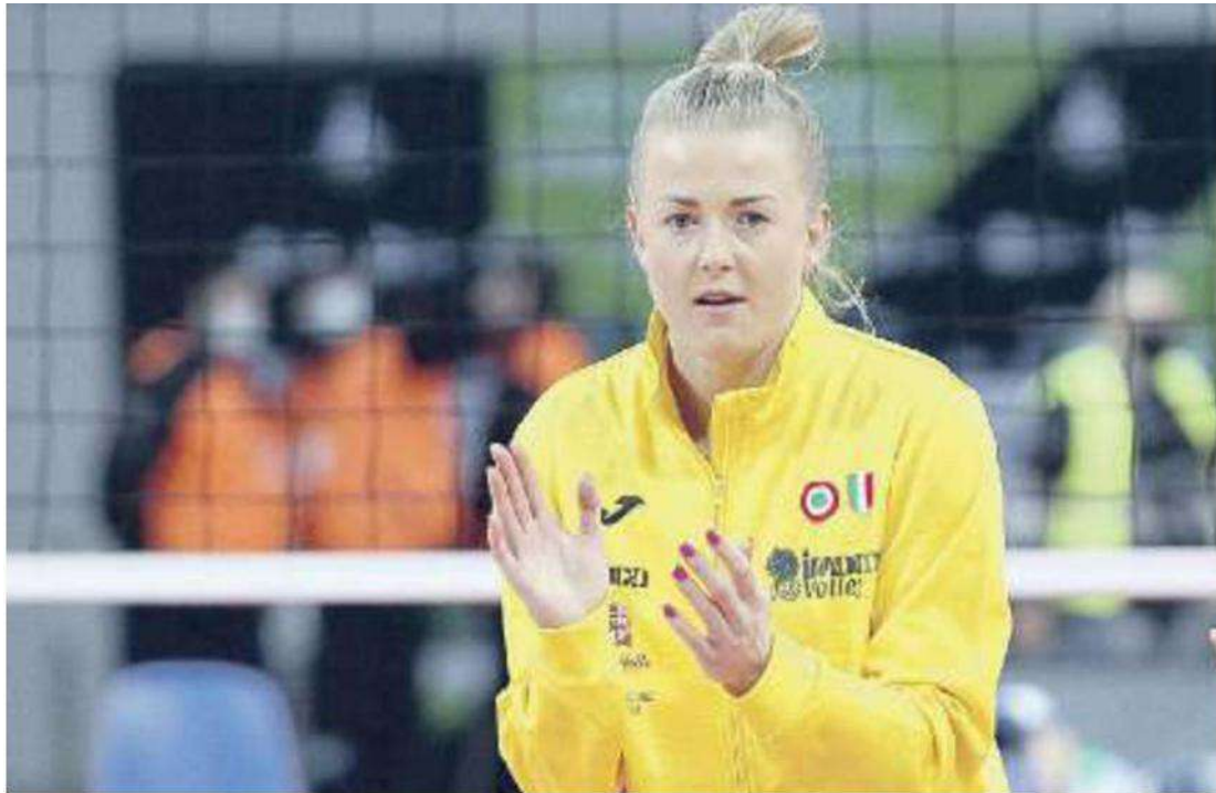
REGISTA La pantera Joanna "Asia" Wolosz mette nel mirino il Mondiale e le Olimpiadi di Parigi 2024

Ritaglio Stampa ad uso esclusivo del destinatario. Non riproducibile