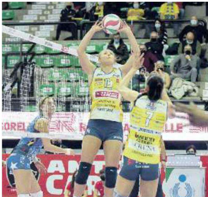
REGISTA La polacca Asia Wolosz attende la chiamata di Lavarini