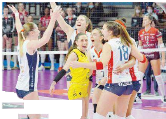
L'esultanza delle giocatrici di Bergamo contro Perugia (LVF)

ARBITRI: Giardini, Piperata. NOTE - Spettatori: 544. Durata set: 30', 22', 23'.