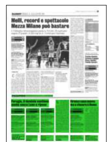
Superficie 29 %