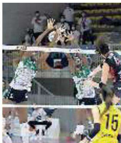
La Megabox a muro