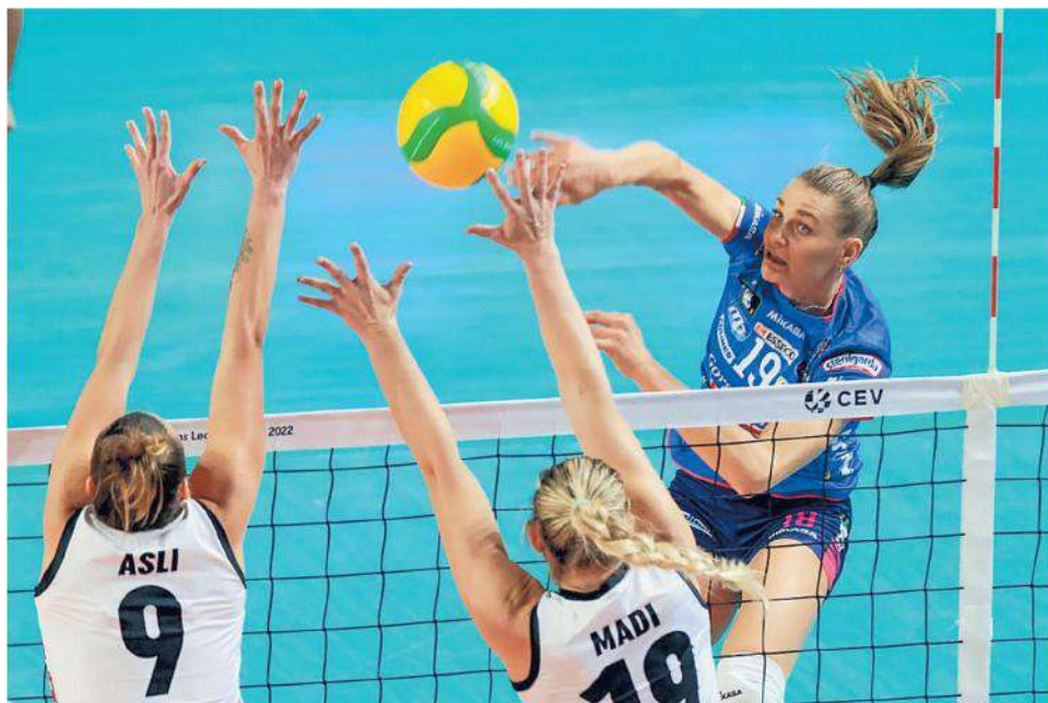
La Igor era già certa della qualificazione come testa di serie, ma ora tutto torna in bilico

Intanto la serie A1 prosegue senza la Igor: oggi un doppio scontro al vertice, Scandicci-Busto Arsizio (alle 17) e Conegliano-Monza (alle 18,15 con diretta Sky sport 1). Ma la classifica è falsata, Novara è a sei punti dal trio di vertice (Conegliano, Monza e Scandicci) con 5 partite da recuperare. —