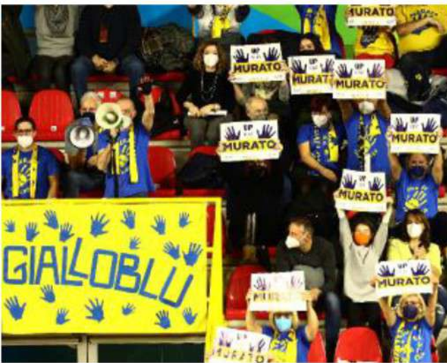
Grande tifo sugli spalti , sembrava il palazzetto pre-Covid

ARTICOLO NON CEDIBILE AD ALTRI AD USO ESCLUSIVO DEL CLIENTE CHE LO RICEVE - 4