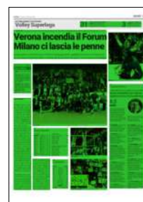
Superficie 78 %

Note durata set: 23', 25', 28', 33', 33'; tot: 142'.