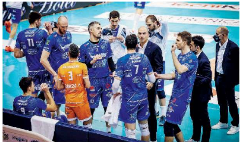
Uno dei tanti time out della Top Volley Cisterna

ARTICOLO NON CEDIBILE AD ALTRI AD USO ESCLUSIVO DEL CLIENTE CHE LO RICEVE - 4