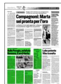
Superficie 19 %

ARTICOLO NON CEDIBILE AD ALTRI AD USO ESCLUSIVO DEL CLIENTE CHE LO RICEVE - 4