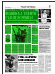
Superficie 41 %

ARTICOLO NON CEDIBILE AD ALTRI AD USO ESCLUSIVO DEL CLIENTE CHE LO RICEVE - 4