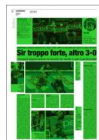
Superficie 73 %

Grbic ha risparmiato il cubano, Solé è l'mvp della serata