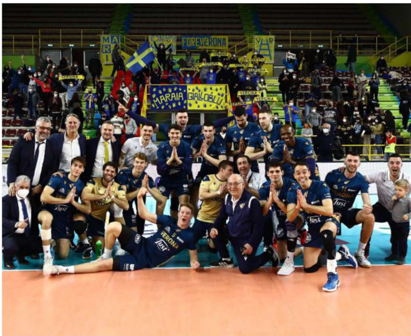
Verona Volley festeggia la vittoria con la classica foto di rito sotto la curva della Maraia Gialloblu

ARTICOLO NON CEDIBILE AD ALTRI AD USO ESCLUSIVO DEL CLIENTE CHE LO RICEVE - 4