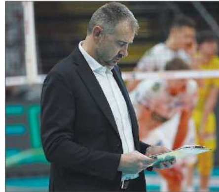
Occhi sul taccuino Il coach della Sir, Nikola Grbic

ARTICOLO NON CEDIBILE AD ALTRI AD USO ESCLUSIVO DEL CLIENTE CHE LO RICEVE - 4