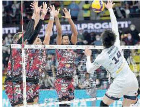
Un momento del match d'andata giocato al PalaBarton

dra tosta ed in un ottimo momento di forma come ha dimostrato nei quarti di Coppa Italia, vincendo e giocando molto bene a Civitanova, ed anche mercoledì vincendo a Monza». La Sir punta a proseguire la marcia in testa alla classifica, contando di fare punti anche nei recuperi appena fissati. Defini-