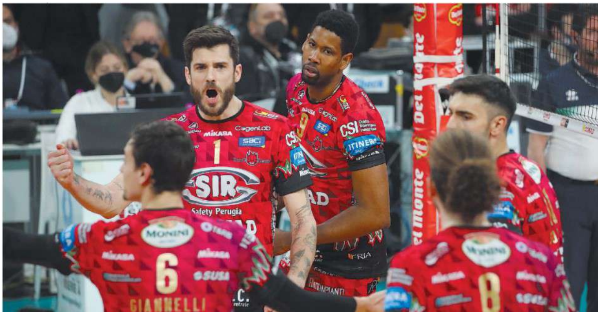
Martelli La Sir punterà sui due schiacciatori Anderson e Leon per scardinare la difesa di Milano all'Allianz Cloud

ARTICOLO NON CEDIBILE AD ALTRI AD USO ESCLUSIVO DEL CLIENTE CHE LO RICEVE - 4