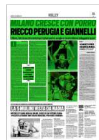
Superficie 55 %

CLASSIFICA: Perugia 41, Civitanova 37, Trento 34, Modena 33, Milano 26, Piacenza 25+, Monza 22++, Verona 19++, Taranto 18+, Padova 17, Cisterna+ 17, Vibo Valentia 9*, Ravenna 2* (+ una gara in più; ++ due gare in più; * una gara in meno)