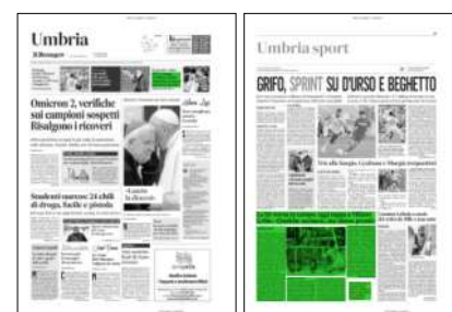
Superficie 18 %

sto il punto di Grbic. «Scordiamoci la gara d'andata perché ci aspetta una battaglia contro una squa-