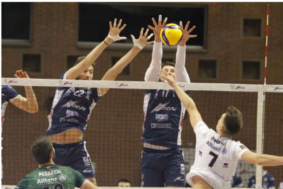
Un muro di Francesco Comparoni e Aleksandr Ljaftov