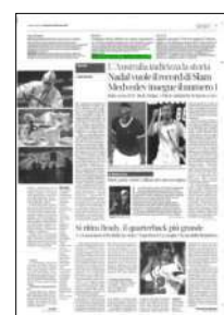
Superficie 1 %

ARTICOLO NON CEDIBILE AD ALTRI AD USO ESCLUSIVO DEL CLIENTE CHE LO RICEVE - 4