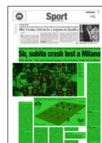
Superficie 58 %