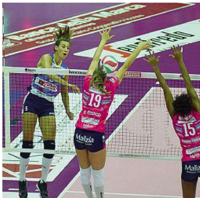
Imoco Le Pantere gialloblù riassaporano il taraflex dopo la sosta forzata