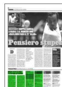
Superficie 13 %

ARTICOLO NON CEDIBILE AD ALTRI AD USO ESCLUSIVO DEL CLIENTE CHE LO RICEVE - 4