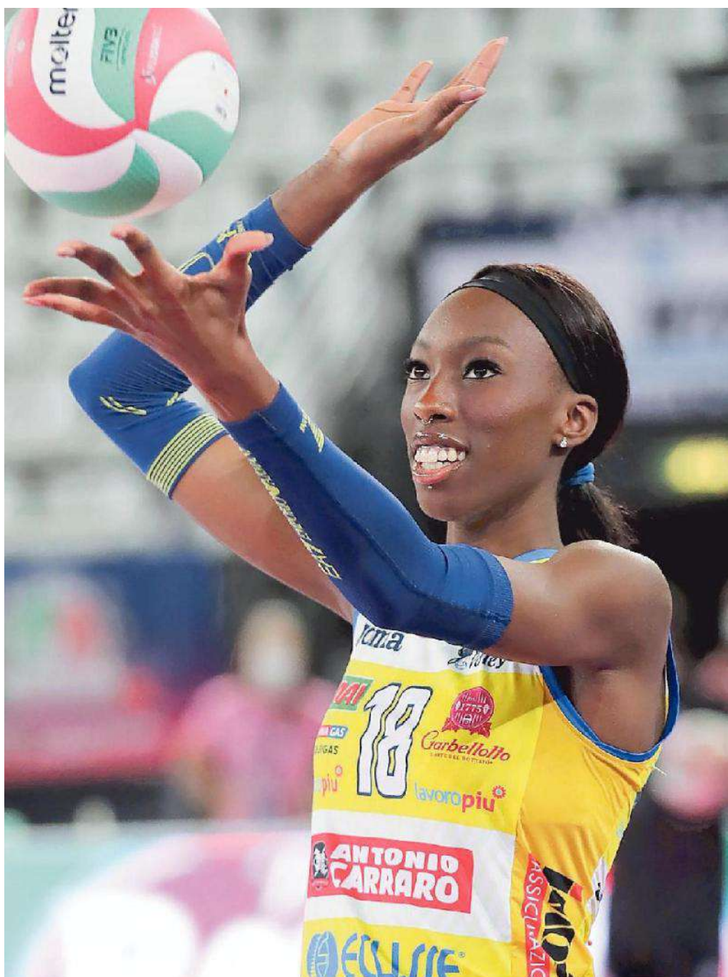
Paola Egonu, opposto della Prosecco Doc Imoco attesa oggi al Palaverde

Ritaglio Stampa ad uso esclusivo del destinatario. Non riproducibile