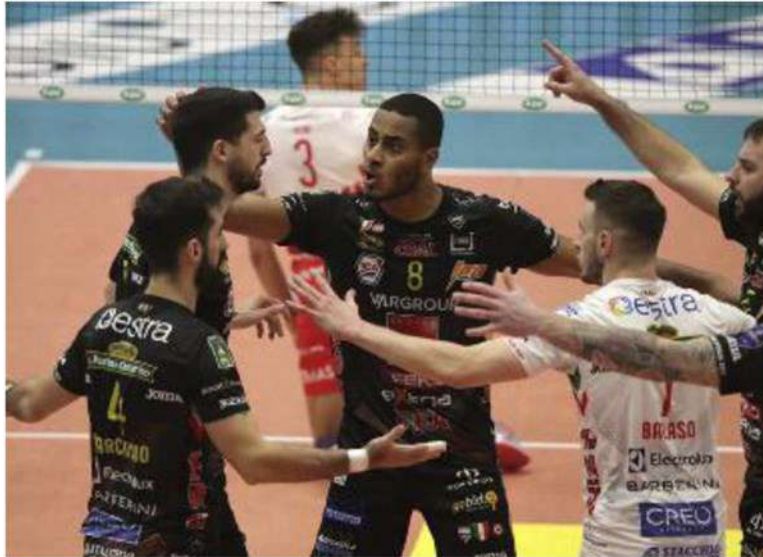
Sfida all'Eurosuole Forum questa sera, con fischio d'inizio alle 20.30

ARTICOLO NON CEDIBILE AD ALTRI AD USO ESCLUSIVO DEL CLIENTE CHE LO RICEVE - 4