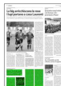
Superficie 11 %

ARTICOLO NON CEDIBILE AD ALTRI AD USO ESCLUSIVO DEL CLIENTE CHE LO RICEVE - 4