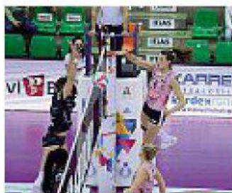
Pantere Rinviata la gara col Fatum

Dopo la Coppa Italia, l'Imoco inizia il 2022 con una vittoria netta in campionato contro Roma. Un risultato importante anche per la classifica, con Conegliano che tiene tre punti di vantaggio sulla coppia formata da Novara e Monza. Il calendario delle Pantere intanto deve fare i conti ancora una volta con il Covid. Le gialloblù dovevano scendere in campo oggi nella penultima giornata del girone di Cham-