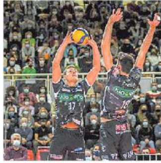
Domani gioca la Kioene

ARTICOLO NON CEDIBILE AD ALTRI AD USO ESCLUSIVO DEL CLIENTE CHE LO RICEVE - 4