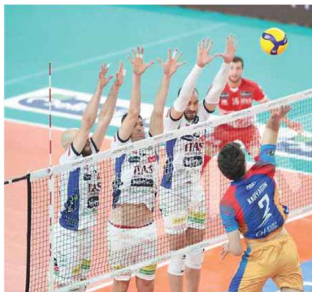
• Muro a tre dell'Itas