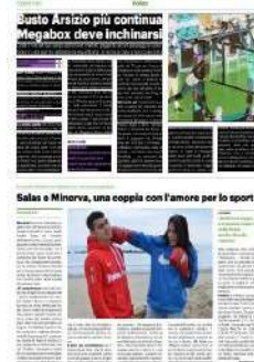
Busto Arsizio più continua Megabox deve inchinarsi

Data: 17.01.2022 Pag.: 15 Size: 337 cm2 AVE: € 6740.00 Tiratura: Diffusione: Lettori: