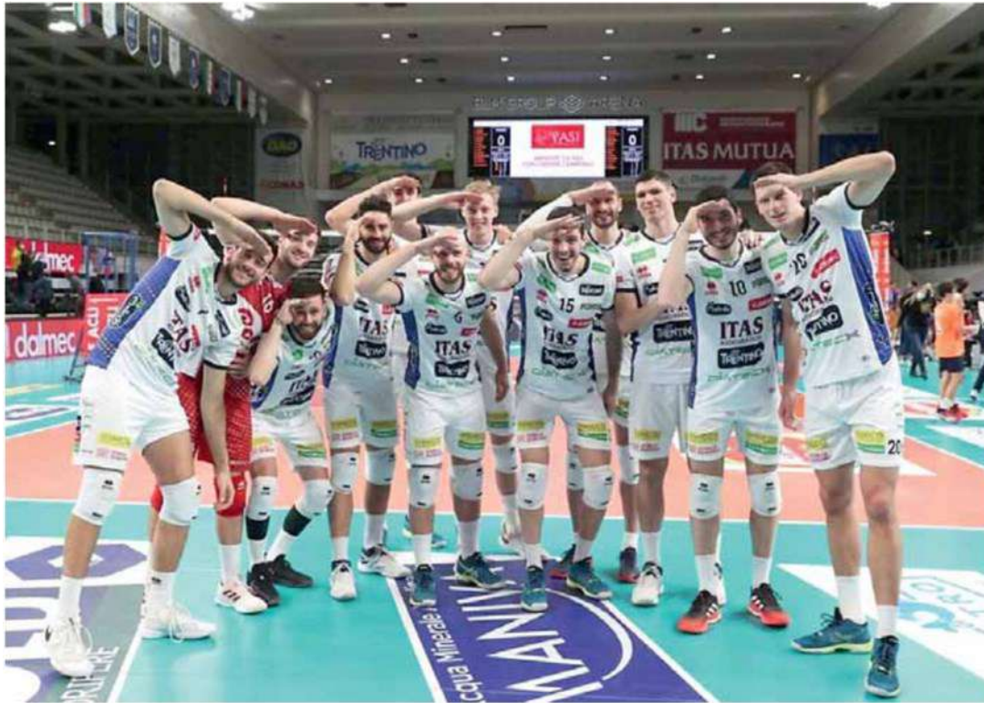
• La curiosa esultanza finale della formazione gialloblù