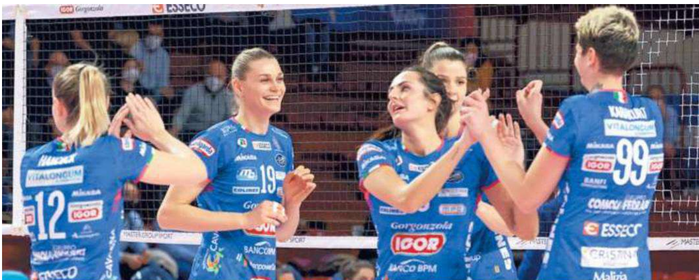
La Igor Novara ha giocato 13 partite ottenendo 11 vittorie e 2 sole sconfitte. Domenica affronterà il big match con Conegliano