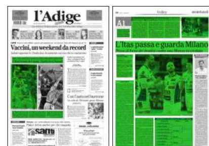
Superficie 84 %