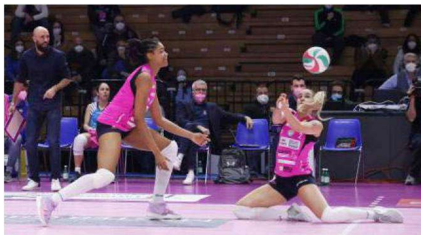
Braga e White della Vbc Casalmaggiore cercano di salvare un pallone in copertura dopo un attacco delle avversarie Mercoledì di nuovo in campo con Scandicci

vigorita dai nuovi arrivi di May e Butigan, protagoniste assolute in avvio per le orobiche. Le toscane, grazie a Lippmann e Pietrini, rimontano e chiudono sul 3-1 salutano Orthmann, schierata titolare ed in lacrime a fine partita destinata al Thy in Turchia. Cuneo deve ricorrere al tie break per superare una coriacea Trento, trascinata sul 2-1 da Rivero e Piani e poi trafitta dalle prove di Degradi, Gicquel ed una monumentale Squarcini. Busto Arsizio, dopo le fatiche di Coppa Italia, torna a far punti tra le mura amiche regolando la rinnovata Megabox Vallefoglia grazie alla solita vena realizzativa di bomber Mingardi e alla partita maiuscola dell'ex Vbc Stevanovic.