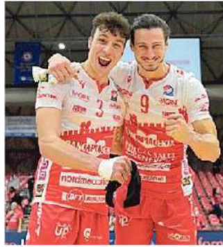
Recine e Rossard (Piacenza)

Monza so è imposta ieri a Taranto per 3-2 nell'anticipo della terza giornata di ritorno giocato ieri. Oggi sarà poi la volta alle ore 16 di Milano-Piacenza (diretta Rai Sport) e di Vibo Valentia-Leo Shoes Perkin Elmer (diretta Volleyball TV). Rinviata a data da destinarsi invece Top Volley Cisterna-Verona Volley, Consar RCM Ravenna-Kioene Padova, Lube Civitanova-Itas Trentino.