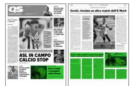
Superficie 46 %