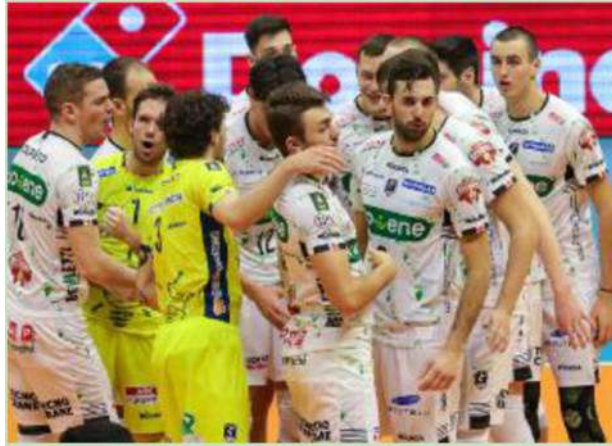
Padova dopo la vittoria contro Monza