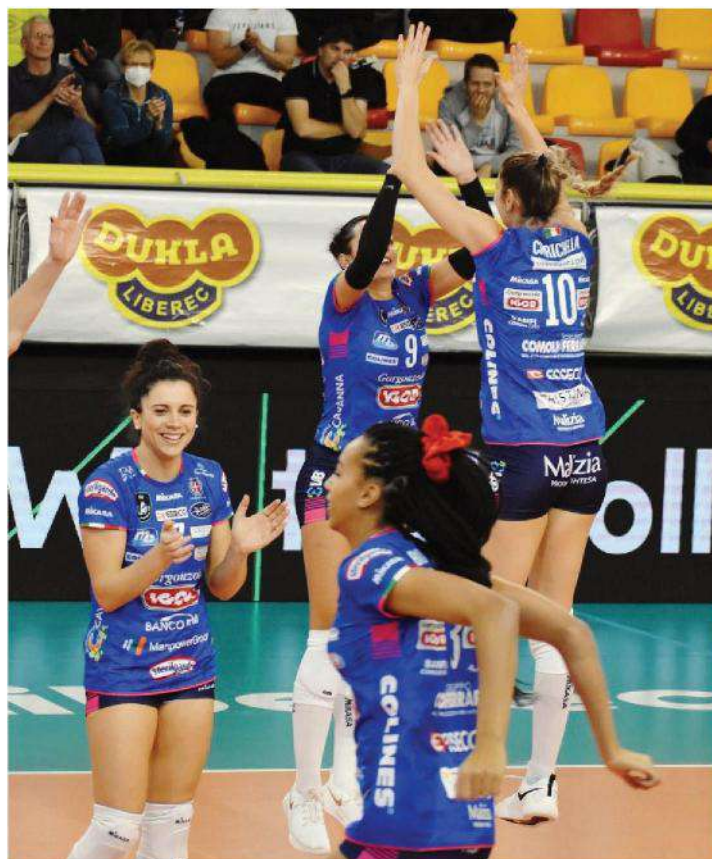
L'Igor Novara è andata in campo con un sestetto sperimentale

Ritaglio Stampa ad uso esclusivo del destinatario. Non riproducibile