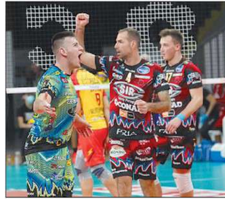
Carica Sir In vista dell'impegno odierno

ARTICOLO NON CEDIBILE AD ALTRI AD USO ESCLUSIVO DEL CLIENTE CHE LO RICEVE - 4