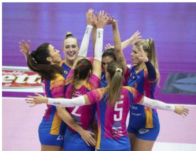
Alle 19.30 la prima storica sfida casalinga di Champions per le ragazze di Monza