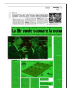
Superficie 60 %

ARTICOLO NON CEDIBILE AD ALTRI AD USO ESCLUSIVO DEL CLIENTE CHE LO RICEVE - 4