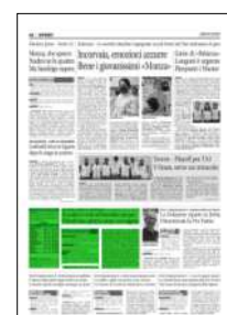
Superficie 9 %

ARTICOLO NON CEDIBILE AD ALTRI AD USO ESCLUSIVO DEL CLIENTE CHE LO RICEVE - 4