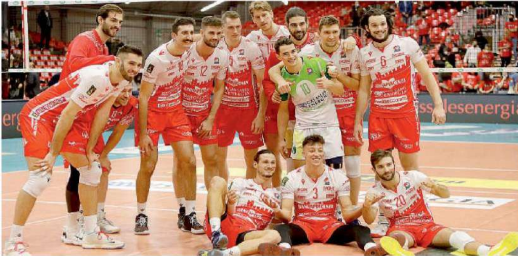
Dopo la vittoria sul Taranto, i biancorossi devono affrontare il temibile Perugia

Volley Superlega , ai biancorossi servono due punti in tre gare. Domani (ore 18) al Palabanca partitissima con Perugia