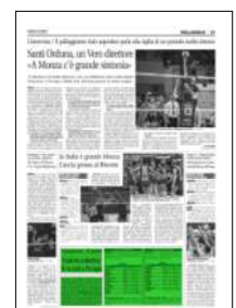
Superficie 10 %

ARTICOLO NON CEDIBILE AD ALTRI AD USO ESCLUSIVO DEL CLIENTE CHE LO RICEVE - 4