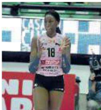
NUOVA MAGLIA Paola Egonu