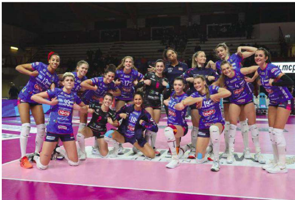
E SONO SETTE... La Igor continua il suo inseguimento a Conegliano