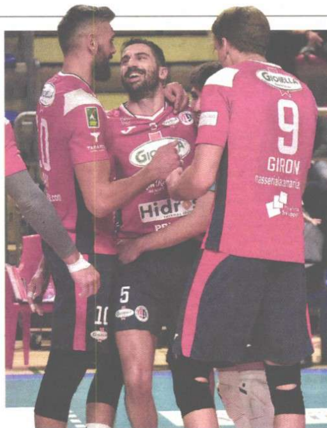
La gioia dei pallavolisti della Prisma CASTELLANETA

ARTICOLO NON CEDIBILE AD ALTRI AD USO ESCLUSIVO DEL CLIENTE CHE LO RICEVE - 4