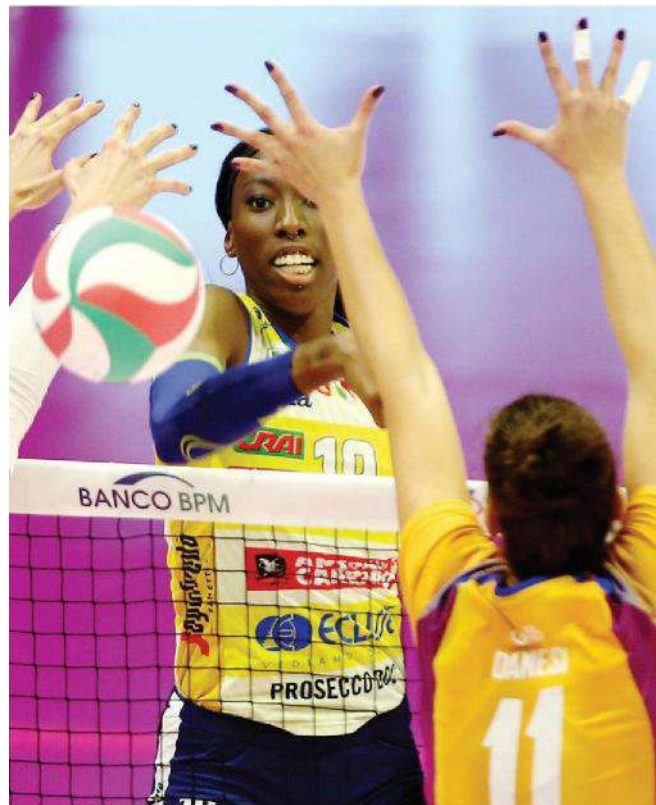
Paola Egonu, 23 anni, stella della favoritissima Conegliano

Ritaglio Stampa ad uso esclusivo del destinatario. Non riproducibile