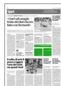
Superficie 3 %

ARTICOLO NON CEDIBILE AD ALTRI AD USO ESCLUSIVO DEL CLIENTE CHE LO RICEVE - 4