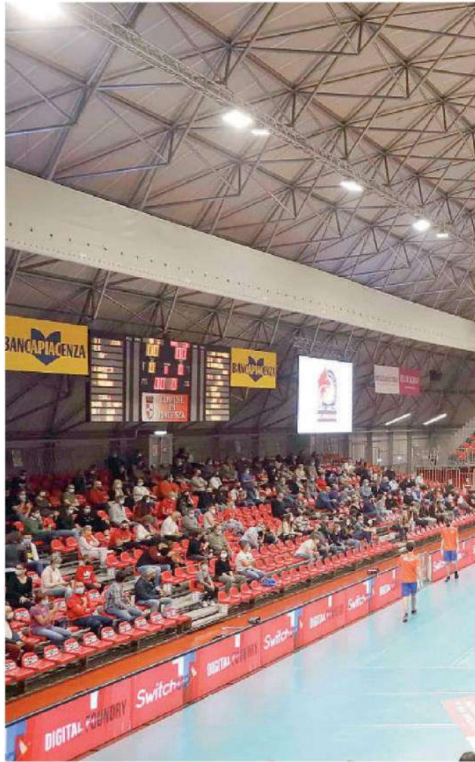
Uno scorcio della tribuna del Palabanca

ARTICOLO NON CEDIBILE AD ALTRI AD USO ESCLUSIVO DEL CLIENTE CHE LO RICEVE - 4