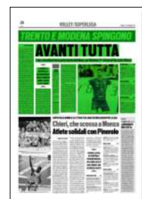
Superficie 39 %

ARTICOLO NON CEDIBILE AD ALTRI AD USO ESCLUSIVO DEL CLIENTE CHE LO RICEVE - 4