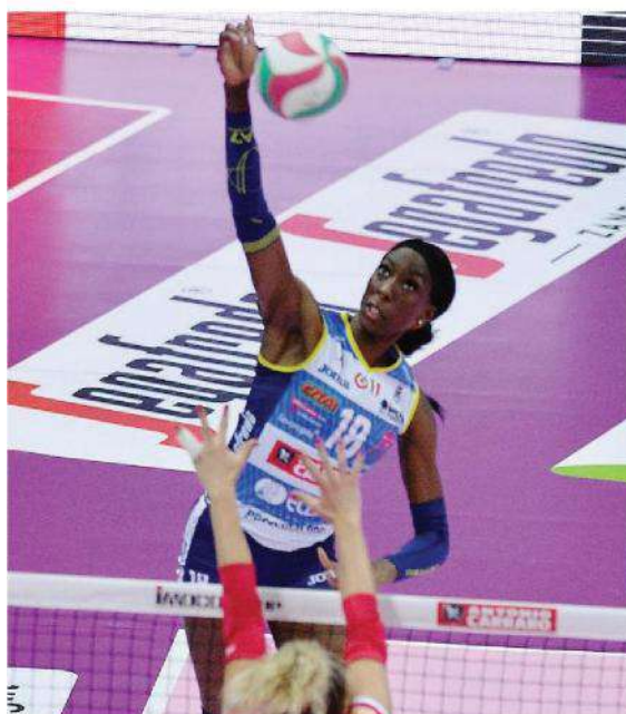
Paola Egonu, 23 anni, ancora una volta decisiva

Ritaglio Stampa ad uso esclusivo del destinatario. Non riproducibile