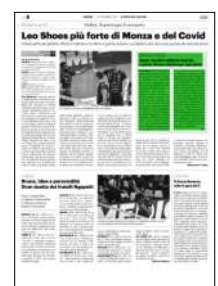
Superficie 9 %

ARTICOLO NON CEDIBILE AD ALTRI AD USO ESCLUSIVO DEL CLIENTE CHE LO RICEVE - 4