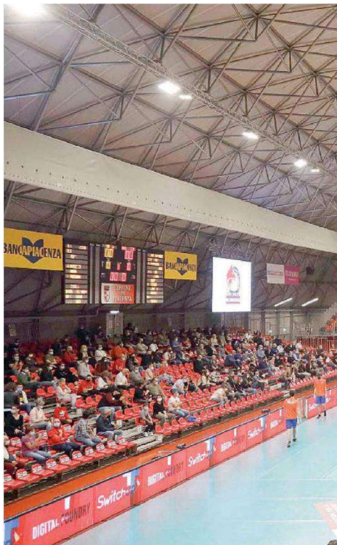
Uno scorcio della tribuna del Palabanca