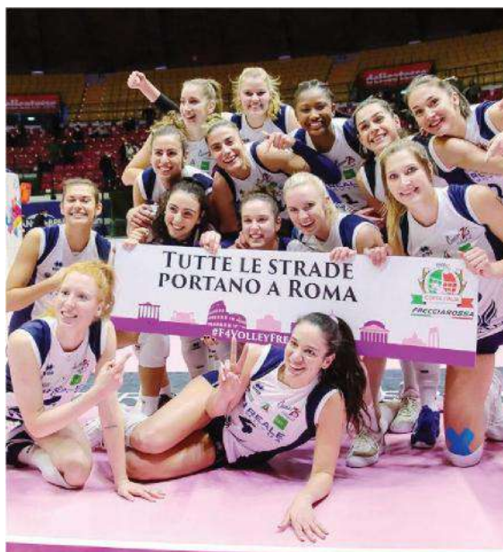
Chieri fa festa: seconda volta alla Final Four (LVF)