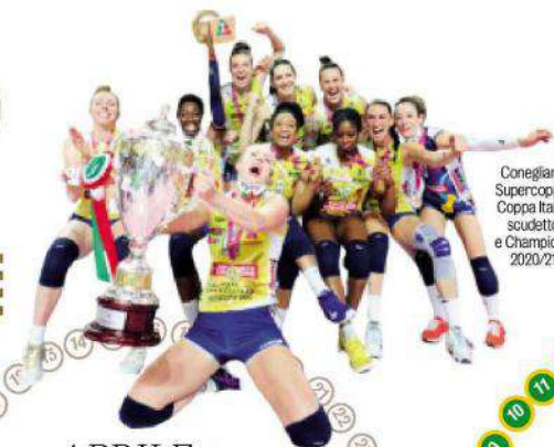
Conegliano Supercoppa, Coppa Italia, scudetto e Champions 2020/21