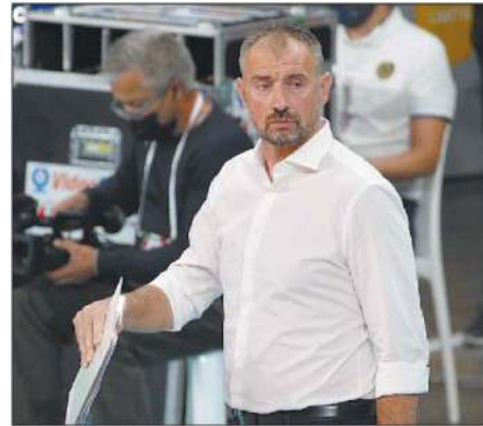
Primi Nikola Grbic e i suoi in vetta a +6 sulla Lube

CLASSIFICA Sir Safety Conad 37, Civitanova 31, Trentino 26*, Modena 25*, Monza 20*, Piacenza 18**, Padova 15, Milano 15***, Verona 13, Cisterna 13, Taranto 10**, Vibo Valentia 9**, Ravenna 2*. (Legenda: * una gara in meno, ** due gare in meno, *** tre gare in meno)