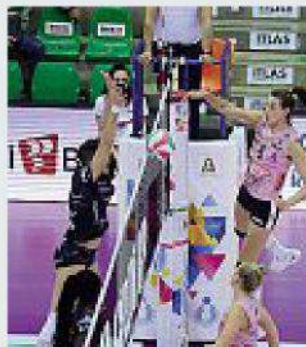
Coppa Italia L'Imoco va per il bis