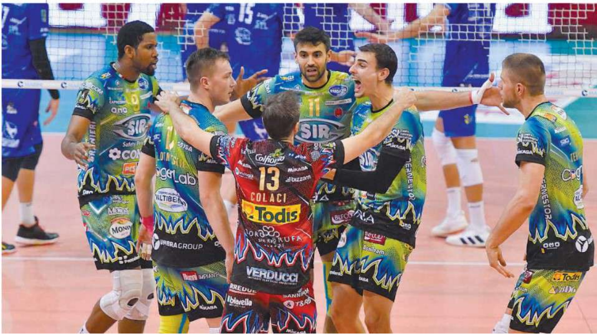
A caccia della settima La Sir Safety Perugia Conad di coach Nikola Grbic cerca la vittoria consecutiva numero sette in campionato, la nona se si considera anche la Champions League