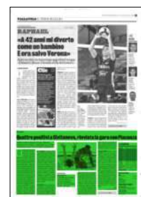
Superficie 32 %

2 gennaio 2022 Ore 15.30: Modena-Ravenna; 18: Trento-Perugia (Rai Sport), Piacenza-Monza, Civitanova-Milano. 16 gennaio 2022 Ore 18: Taranto-Verona; Vibo V.-Cisterna. Riposa: Padova