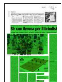
Superficie 60 %