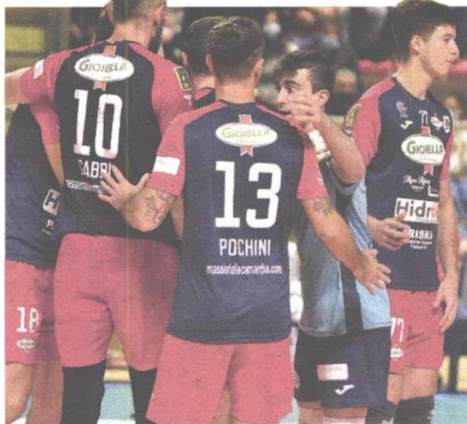
L'esultanza della Gioiella Prisma Taranto CASTELLANETA

ARTICOLO NON CEDIBILE AD ALTRI AD USO ESCLUSIVO DEL CLIENTE CHE LO RICEVE - 4