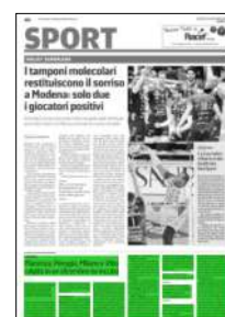
Superficie 16 %

A determinare la decisione della Lega il numero sempre più crescente di positività al Covid-19 riscontrate all'interno delle varie squadre: una settimana di passione per le società femminili, con rinvii a catena che hanno indotto la Lega, visti i due soli incontri rimasti in calendario alla vigilia di Natale, su sette in programma, a posticipare tutta l'ultima giornata di andata. Se ne ripalerà con l'anno nuovo.