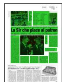
Superficie 49 %

ti di finale della Del Monte Coppa Italia. Le quattro partite, originariamente programmate per domenica 2 gennaio che decideranno l'accesso all'Unipol Arena (la Final Four è in programma il 22 e 23 gennaio), sono state posticipate a domenica 16 gennaio. A lasciare lo spazio a queste gare sarà il turno di campionato programmato per quel giorno, la quinta di ritorno, che viene quindi anticipata dal 16 al 2 gennaio. Slitta, quindi, ovviamente il quarto di finale che vedrà in campo Perugia che, con il vantaggio del fattore campo guadagnato dopo il primo posto nel girone d'andata, affronterà l'ottava della classifica che, in attesa degli ultimi recuperi ancora da effettuare, sarà una tra Allianz Milano e Kioene Padova. Domenica prossima 2 gennaio, dunque, trasferita in quel di Trento per i Block Devils di Nikola Grbic con diretta tv su Rai-sport, canale 58 del digitale terrestre, a partire dalle ore 18.