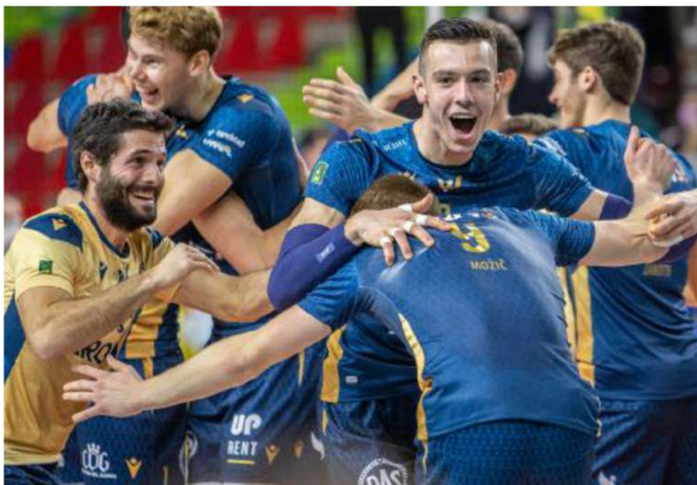
La gioia della squadra dopo la vittoria per 3-2 in rimonta contro Trento

ARTICOLO NON CEDIBILE AD ALTRI AD USO ESCLUSIVO DEL CLIENTE CHE LO RICEVE - 4