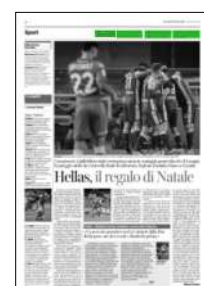
Superficie 1 %

ARTICOLO NON CEDIBILE AD ALTRI AD USO ESCLUSIVO DEL CLIENTE CHE LO RICEVE - 4