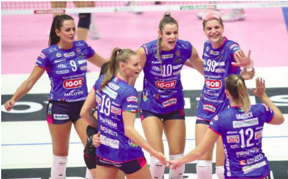
TOUR DE FORCE In alto le ragazze della Igor, sotto la formazione della Dinamo Mosca