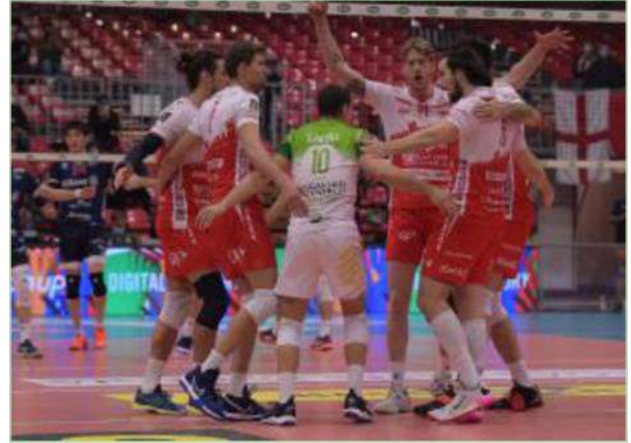
Piacenza, una squadra con tante soluzioni di gioco

Ha invece perso gli ultimi due scontri diretti, senza peraltro muovere la classifica, prima a Trento e poi tra le mura amiche contro Perugia, dove ha tenuto testa agli ospiti solo nei primi due parziali, cedendo nettamente nel terzo. M.B.