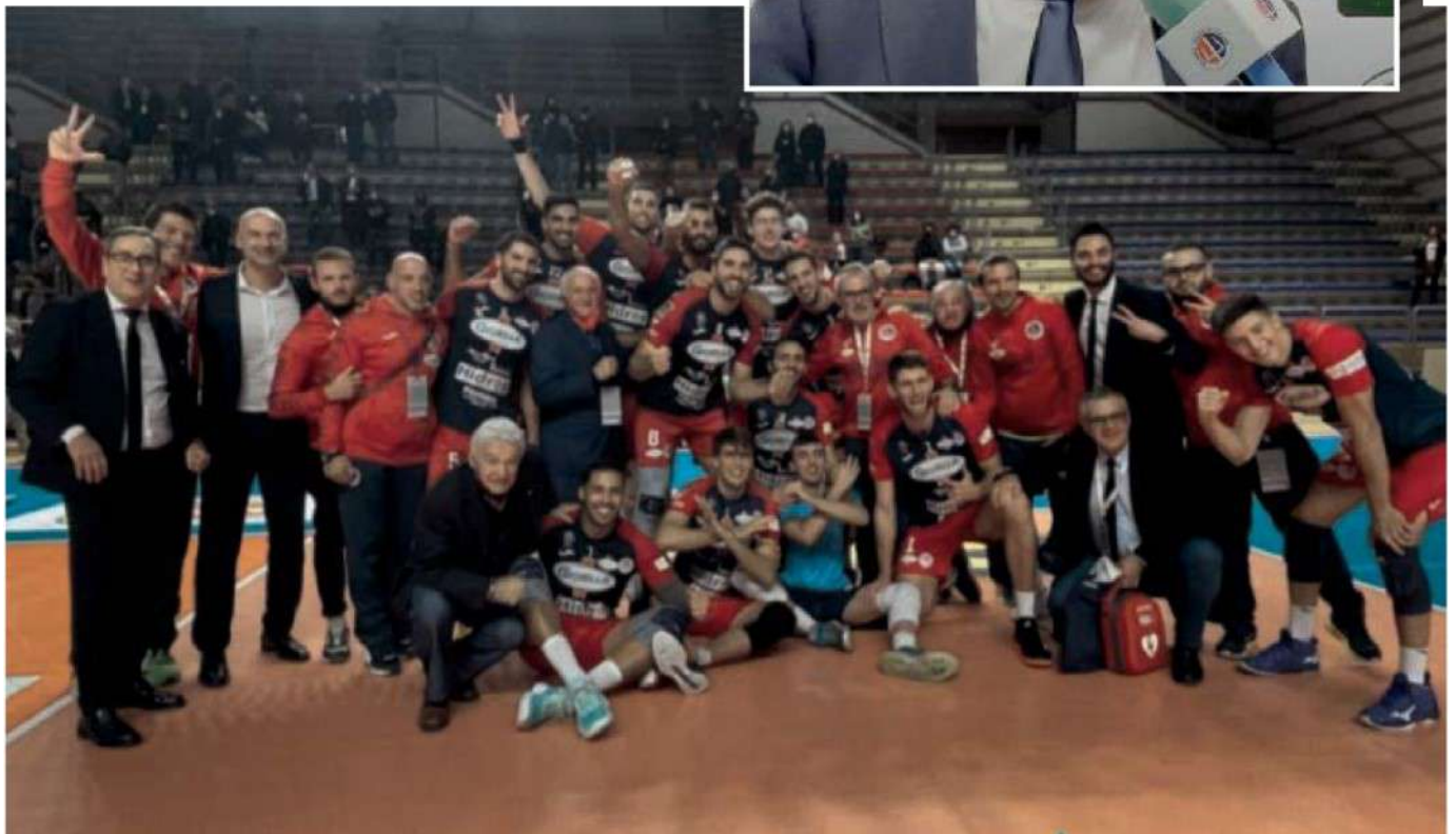
FESTANTI La Gioielli Prisma Taranto dopo una vittoria. I rossoblù hanno saltato la gara con Milano (per il Covid-19 che ha colpito quattro atleti della squadra lombarda). Al momento non si conosce la data di recupero

ARTICOLO NON CEDIBILE AD ALTRI AD USO ESCLUSIVO DEL CLIENTE CHE LO RICEVE - 4