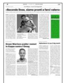
Superficie 4 %

ARTICOLO NON CEDIBILE AD ALTRI AD USO ESCLUSIVO DEL CLIENTE CHE LO RICEVE - 4