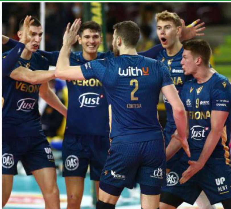
Verona Volley si prepara a un'altra battaglia